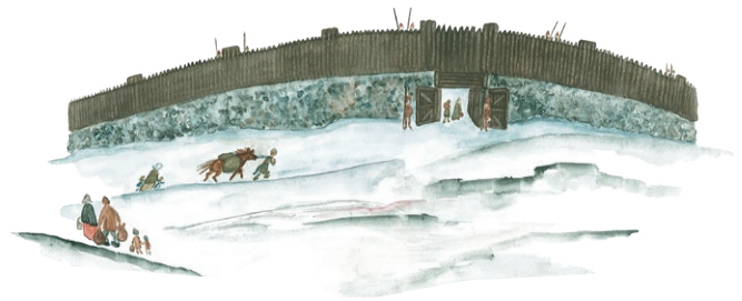
Kanske var det så här fornborgen såg ut Illustration: Margareta Hildebrandt

Uppe på bergskrönet ligger resterna efter en fornborg från järnåldern (500 f.Kr-1050 e.Kr). Platsen ger en bra överblick över landskapet och de branta sluttningarna gav borgen ett naturligt skydd åt ett håll. På övriga sidor skyddades borgen av halvcirkelformade stenmurar. Rester efter dessa murar finns idag i form av två stenvallar. Den längsta och kraftigaste vällen är cirka 70 meter lång med en ingång i nordost.