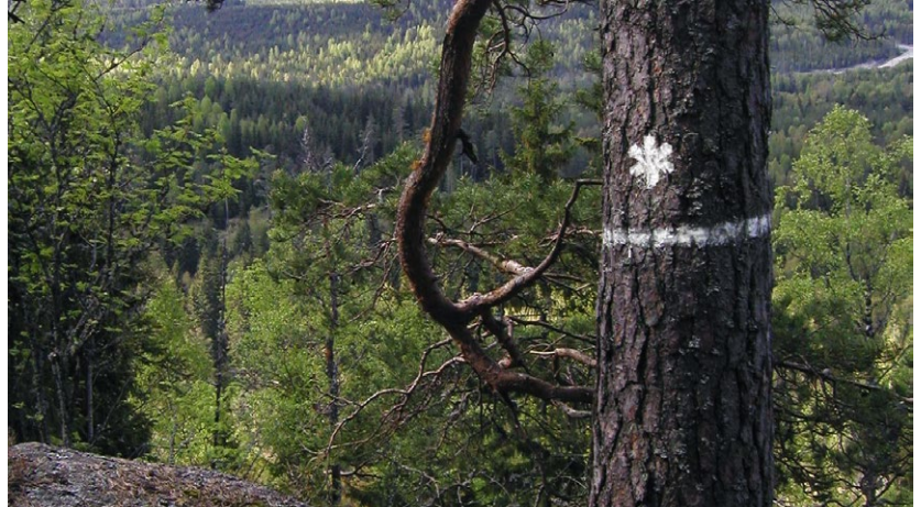
Utsikt från fornborgen.

Naturreservatet Klunkhytte skans har fått sitt namn efter resterna av den fornborg som ligger på ett bergskrön i reservatet. Området kring fornborgen skyddades som domänreservat redan på 1940-talet, så skogen har fått utvecklas fritt under mer än 50 år. Det finns gott om gamla och döende träd med tydliga spår efter hackspettar, bland annat den tretåiga hackspetten.