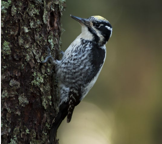
Tretåig hackspett.