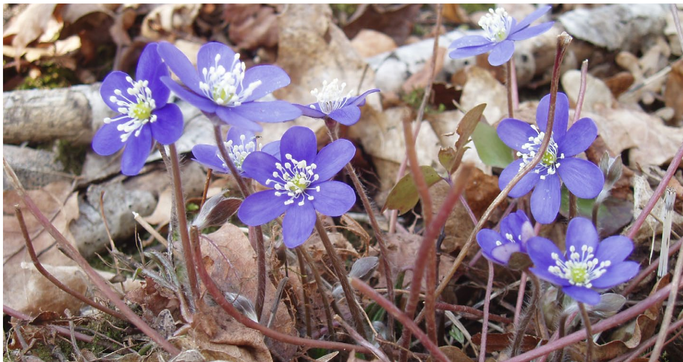
Blåsippor trivs på kalkrik mark.

Naturreseptatet Ödesdovra består av gammal barrskog med inslag av äldre betesmark. På grund av den kalkrika berggrunden trivs här en mångfald av såväl växter som svampar och mossor.