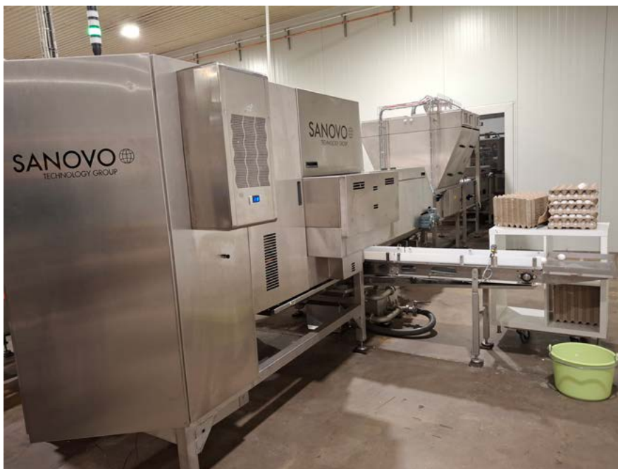
Del av packmaskin.