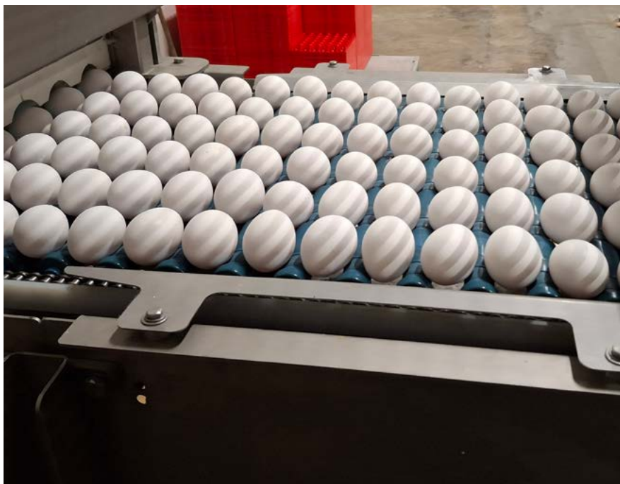
Ägg på transportband.