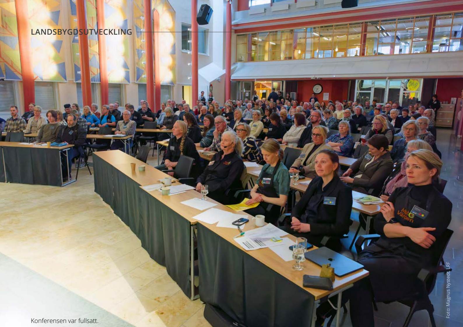
Konferensen var fullsatt.