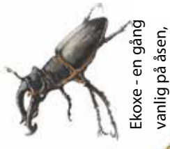
Eko - en gång vanlig på åsen,

Här kan du njuta av rent och friskt vatten direkt från en kalkkälla. Förr i tiden åkte man ända från Prästgården i Hassöv för att hämta sitt dricksvatten ur källan. In till källan låg det fram till 1982 en dansbana.