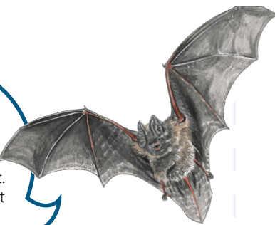
Illustration: Katarina Månsson

Den ovanliga fladdermusarten barbastell har sina jaktmarker i reservatet. Barbastellen är mycket sällsynt och globalt hotad.