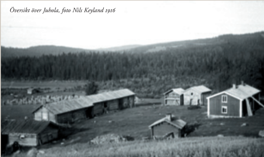
Översikt över Juhola, foto Nils Keyland 1916

I skogstrakterna norr och väster om Torsby finns ett antal finngårdar och torp med odlingsmarker som vittnar om de skogsfinska bosättningarna i Värmland. Kulturresevatet Juhola finngård bevarar ett av dessa odlingslandskap med sin speciella flora och sitt karaktäristiska byggnadsbestånd.