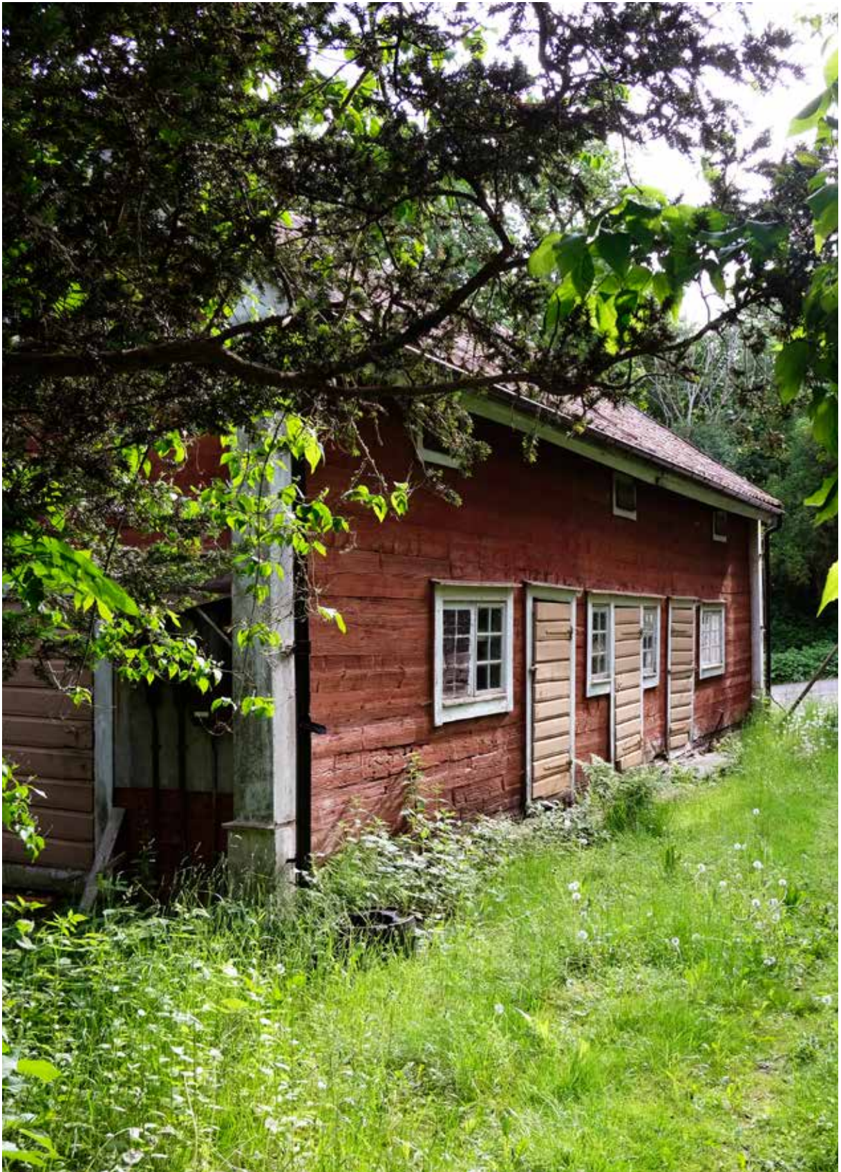
En överloppsbyggnad som bidrar till gårdsbilden