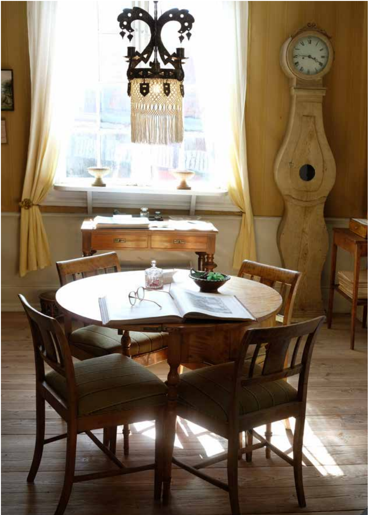
Interiör, Skottsbergiska gården, Karlshamn