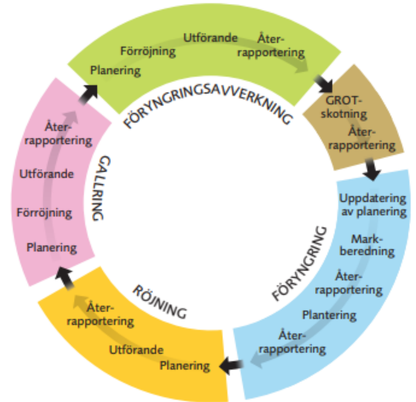
Bild som beskriver skogsbrukets alla processteg, framtagna av Skogforsk 2016.