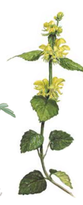
Gulplister Lamium galeobdolon