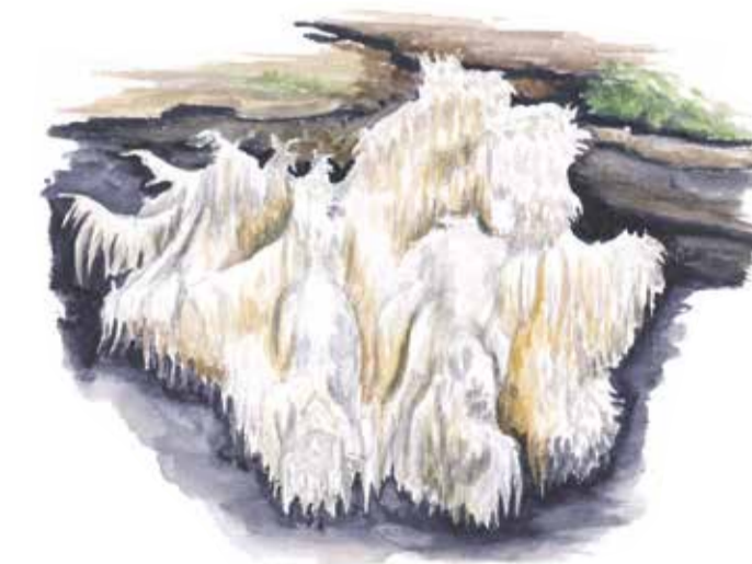
Koralltaggsvampen hittas främst på starkt förmultnade stockar med mjuk ved.