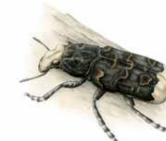
Storplattnosen har ett speciellt utseende och är lätt att känna igen. Den bara 8-18 mm långa skalbaggen lägger sina larver inuti en svamp som växer på döende träd.