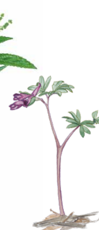
Smånunneört Corydalis intermedia