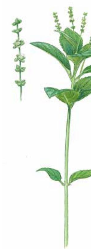
Skogsbingel Mercurialis perennis