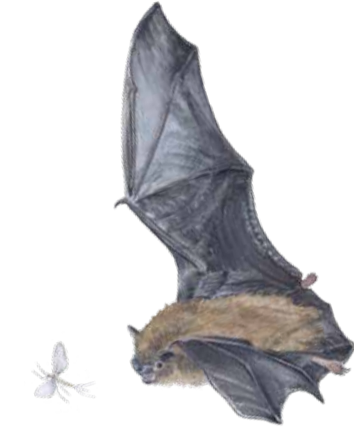
Dvärgpipistrell Pipistrellus pygmaeus Soprano pipistrelle