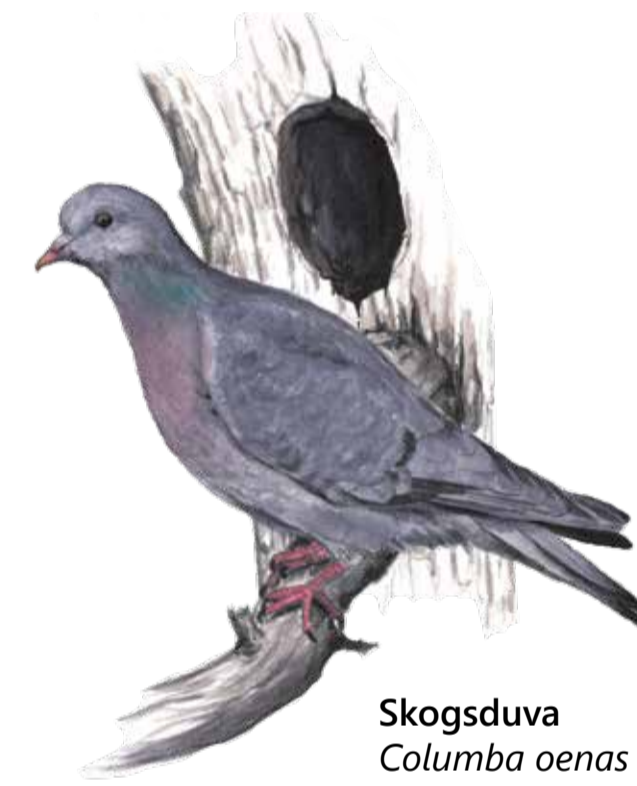
Skogsduva Columba oenas Stock dove