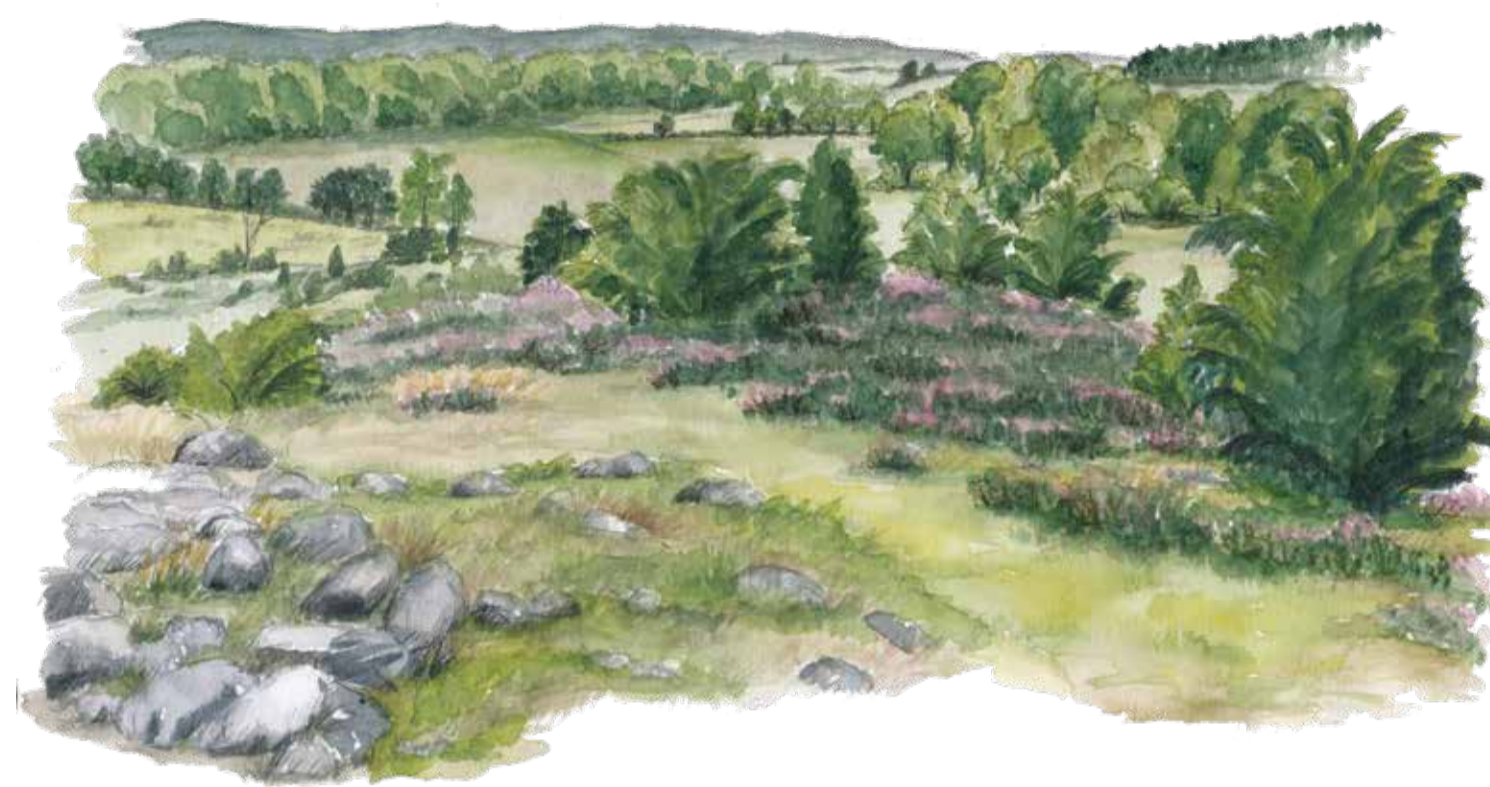
Fältpiplärkan är de öppna sandmarkernas karaktärsfågel. Boet byggs ofta i skydd av en grästuva. Anthus campestris Tawny pipit