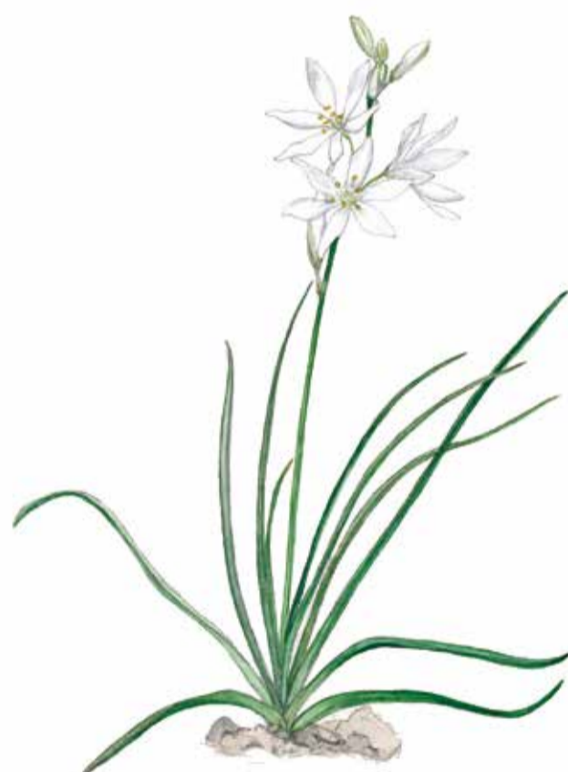
Stor sandlilja är en typisk sandstappsart. Anthericum liliago

Den exotiska sommargyllingen håller till i lövträdens täta kronor. Den kan vara svår att få syn på men vackra sommarmorgnar i månadsskiftet maj-juni kan du höra hanens flöjtande sång.