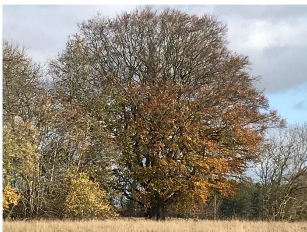
Boken fotograferad från söder

Naturföremålet består av en synnerligen stor och grov bok. Boken är en av Skånes grövsta bokträd och bedöms vara unik i sitt slag. Hälsotillståndet bedöms som mycket gott. Trädet står i kanten till en öppen betesmark och förnärvarande finns inget vårdbehov, närmast stående träd utgörs av en alm (CR) som troligen tyvärr kommer drabbas av almsjukan inom några år. Kring boken sker bete med nötkreatur vilket är bra för trädets vård. Bokarnas har högst sannolikt varit ett vårdträd till den gård som idag utgör en ruin och som ligger strax nordväst om boken.