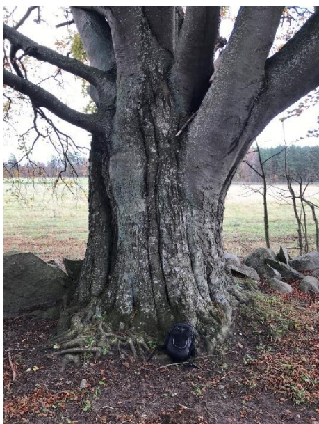
Notera ryggsäcken i förhållande till boken