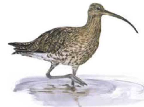
Storspoven ( Numenius arquata ) häckar på de öppna betes- och slättermarkerna.