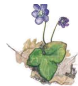
Blåsippa Hepatica nobilis

I betesmarker som Västra fäladen blandas blommande ängar med buskrika områden. Det är rika fjärilsmarker med flera arter bastardsvärmare, hagtornfjäril och olika arter av blåvingar.