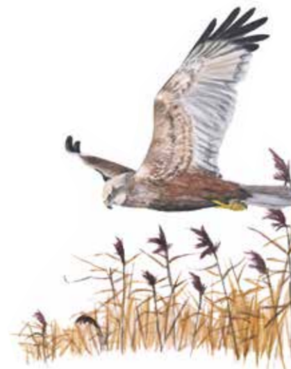
Brun kärrhök Circus aeruginosus

Under hösten, vintern och våren gästas sjön av stora mängder änder, gäss och svanar. Havsörnen kan ses glida över sjön under hela året.