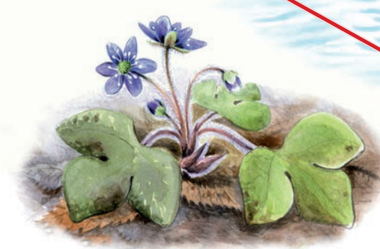
Blåsippa • Liverwort Hepatica nobilis