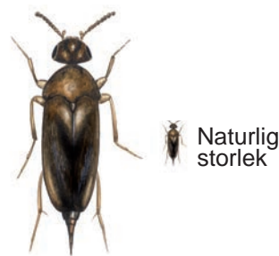
Gul gaddbagge • A rare Mordellistena beelte Mordellistena neuwaldeggiana