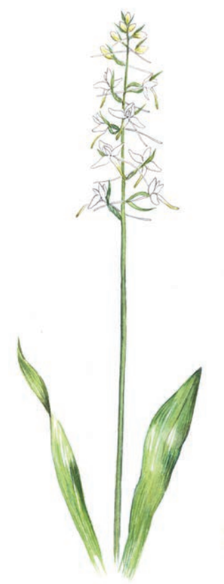
Skogsnattviol • Lesser Butterfly-orchid Platanthera bifolia ssp bifolia