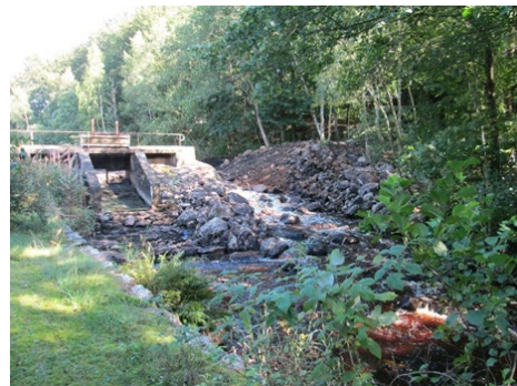
Figur 2. Sommaren 2014 öppnades delar av dammvallen upp och dammen sänktes av. Idag kan alla fiskarter vandra förbi dammet.