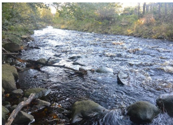
Figur 6. Uppströmsdelen av det före detta damm-området. Vid elfisket här 2016 fångades bland annat lax- och öringungar, se tabell 2.