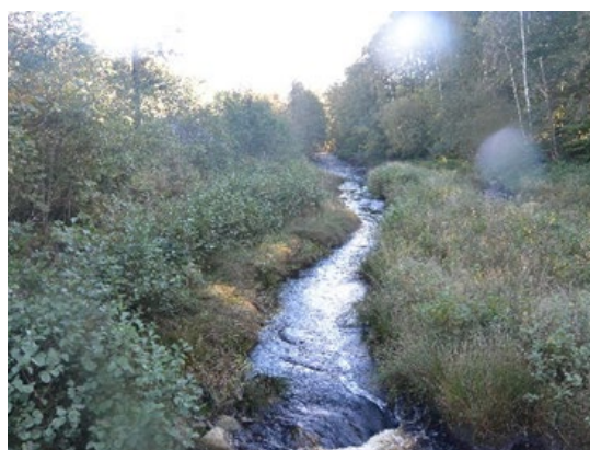
Figur 7. Dammområdet år 2017. Självsådd al har börjat etalbera sig och en tydlig åfåra slingrar sig fram i en vegetationsklädd tidigare dammbotten.