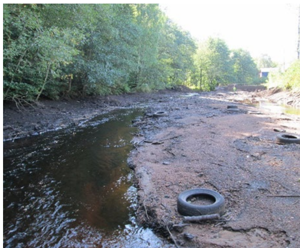
Figur 4. Dammmområdet vid Stendalsmölla direkt efter avsänkning av dämnet 2014.

Nedan visas bilder på åtgärden vid Stendalsmölla direkt efter åtgärd, figur 4 och 5, samt något år senare, figur 6 och 7.