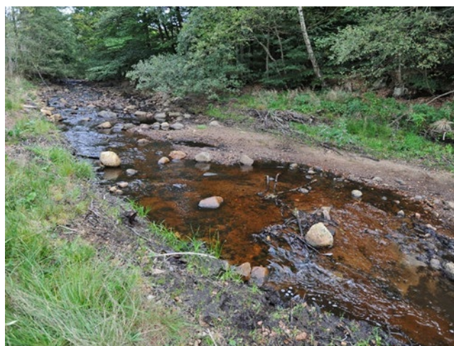
Figur 5. Dammmområdet ett år senare, 2015. Skräpet som fanns har körts till återvinning och gräset har börjat etablera sig på den tidigare dammbotten.