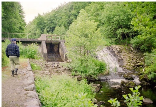
Figur 1. Vid Stendalsmölla fanns tidigare en damm som var ett definitivt vandringshinder för alla fiskarter.

Vid Stendalsmölla har en damm som utgjorde ett definitivt vandringshinder för fisk sänkts av år 2014, figur 1 och 2.