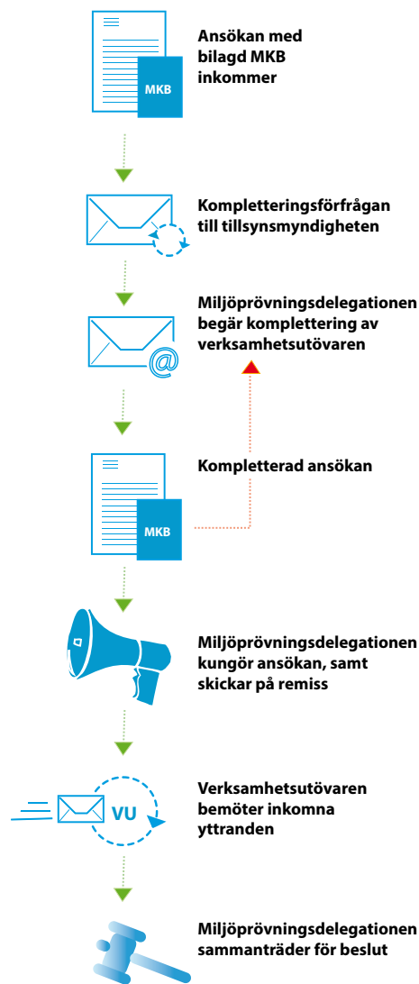
Figur 2 De olika stegen för ett ärende där Miljöprövningsdelegationen är beslutande.

Hos aktförvararen finns ansökan och övriga handlingar i ärendet tillgängliga under expeditionstid. Handlingarna finns också tillgängliga hos tillståndsmyndigheten. De remissinstanser och sakägare som har något att invända eller framföra skriver till länsstyrelsen. Det bör observeras att det inte räcker med att man framfört skriftliga eller muntliga synpunkter under samrådsprocessen eller i ett eventuellt planärende. Vad man vill ha sagt måste upprepas i tillståndsärendet.