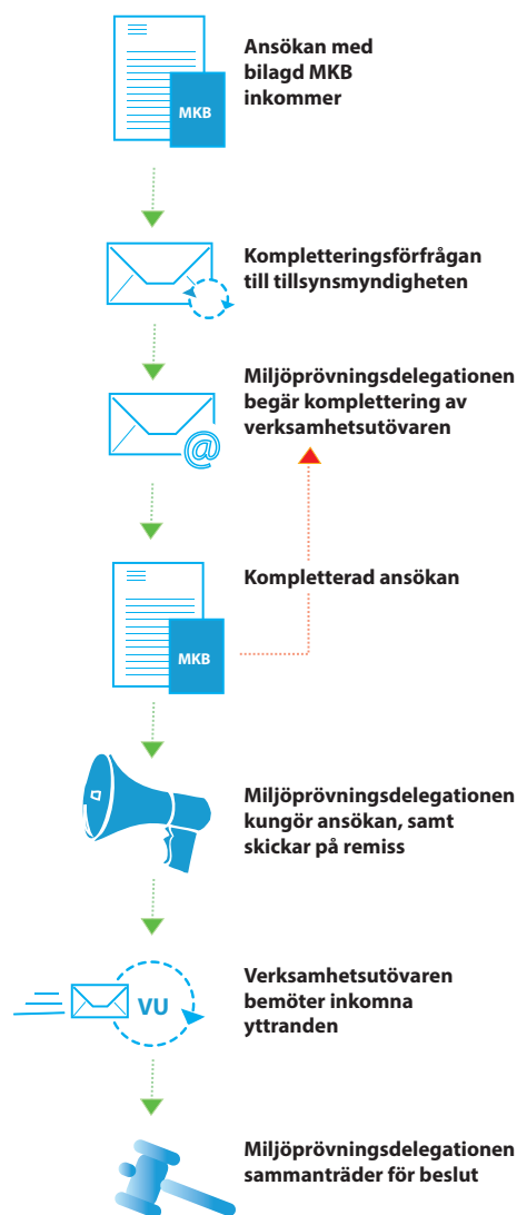
Figur 2 De olika stegen för ett ärende där Miljöprövningsdelegationen är beslutande.

Hos aktförvararen finns ansökan och övriga handlingar i ärendet tillgängliga under expeditionstid. Handlingarna finns också tillgängliga hos tillståndsmyndigheten. De remissinstanser och sakägare som har något att invända eller framföra skriver till länsstyrelsen. Det bör observeras att det inte räcker med att man framfört skriftliga eller muntliga synpunkter under samrådsprocessen eller i ett eventuellt planärende. Vad man vill ha sagt måste upprepas i tillståndsärendet.