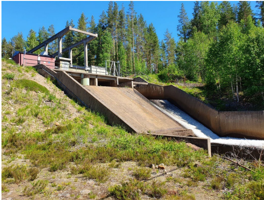
Figur 2: Gustavsström 2 kraftverk.

Hänsyn till kulturmiljö inom detta område innebär att vara varsam vid eventuella renoveringar interiört och att den exteriöra traversbanan bevaras. Eventuella faunapassager kommer inte påverka kulturmiljön i området.