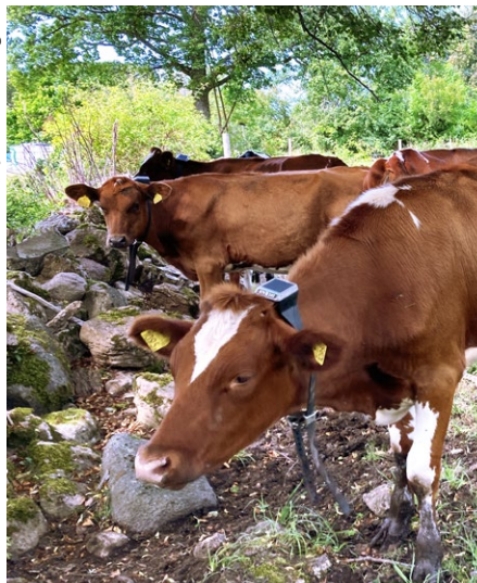
Kor med utrustning för virtuella stängsel.

Från och med 1 januari 2026 är det godkänt med virtuella stängsel för nötkreatur och får i Sverige.