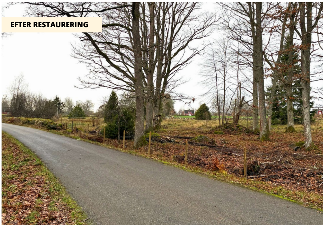
Samma betesmark efter restaurering. (Från motsatt håll.)