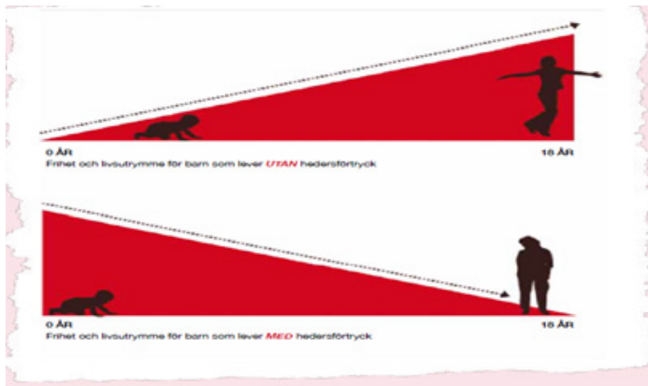
Figur från Länsstyrelsen Östergötlands rapport "Det handlar om kärlek" (2013)