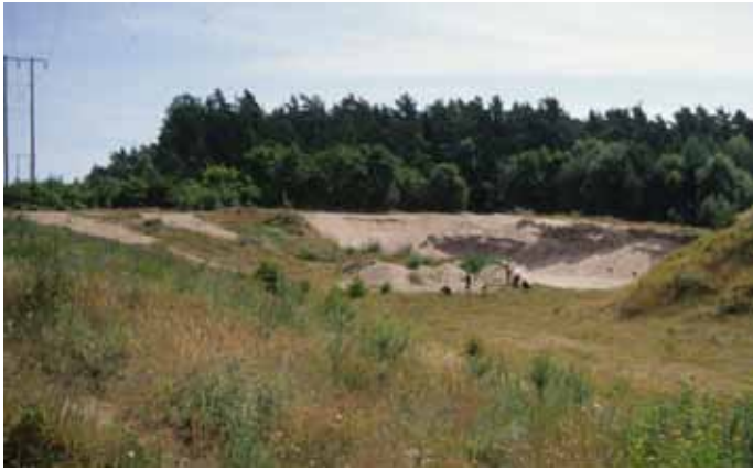
Häljarums naturreservat. Det finns gott om blottad sand och många olika sällsynta bin lever här.