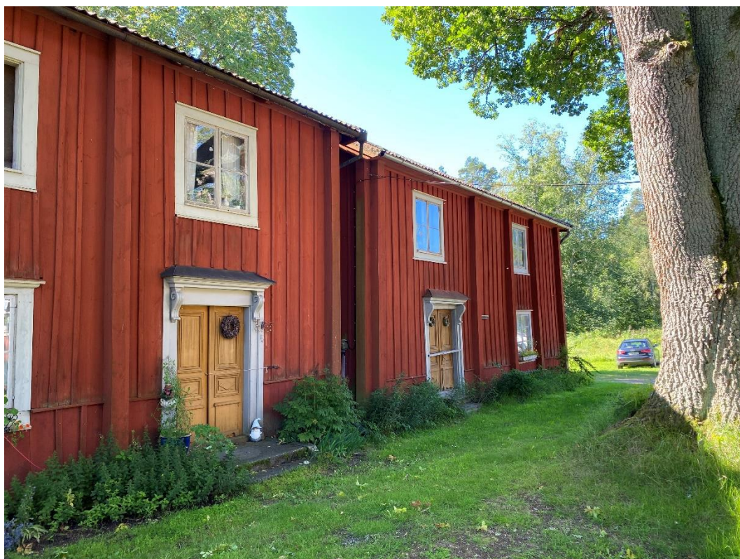
Figur 1. Bostadshusen på den södra sidan om gårdsplanen är speciellt välbevarade.

Byggnaderna är ålderdomliga och väl bibehållna från ursprunget, speciellt de två husen på gårdens södra sida. Husen har en karaktärsfull exteriör i två våningar under sadeltak. Väggarna är klädda med stående locklistpanel och målade i falurött med vita omfattningar och foder. Kring dörrarna har skapats dekorativa portaler. En av byggnaderna på norra sidan har försetts med en enkel förstukvist samt moderniserats 1948.