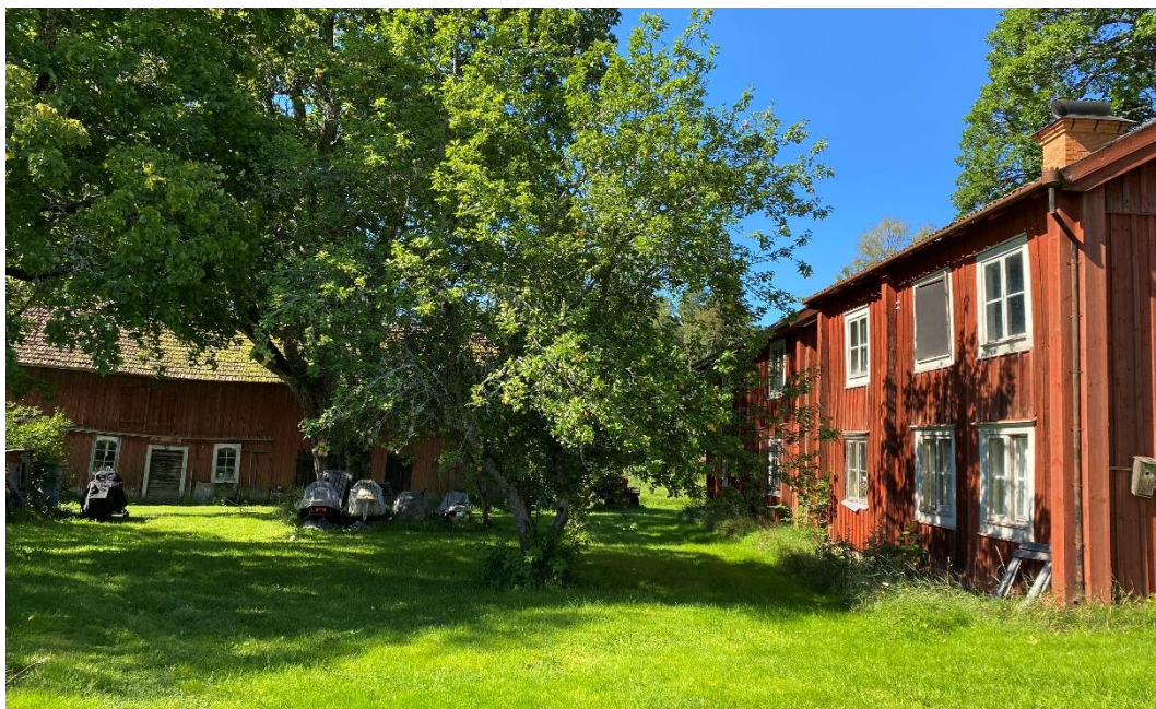
Figur 3. En av gårdens två ladugårdar skymtar bakom träden.