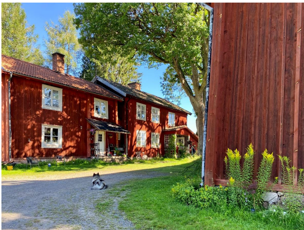
Figur 2. Placeringen av de fyra bostadshusen kring gårdsplanen är ovanlig.