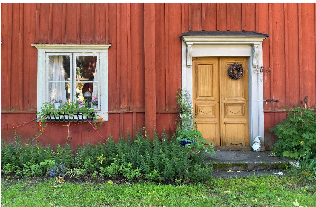
Figur 4. De mer välbevarade bostadshusen har omfattningar med välbevarat 1700-talsformspråk.