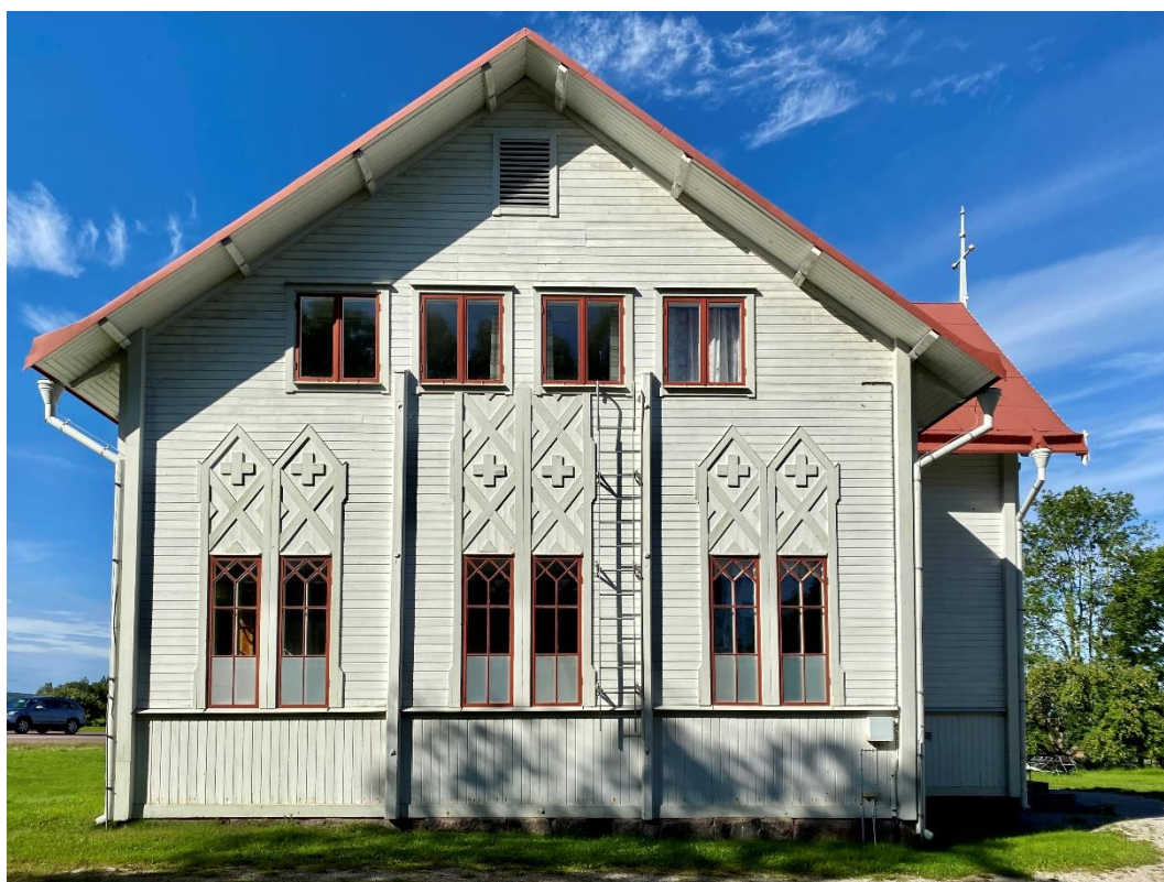
Figur 2. Östra gaveln.