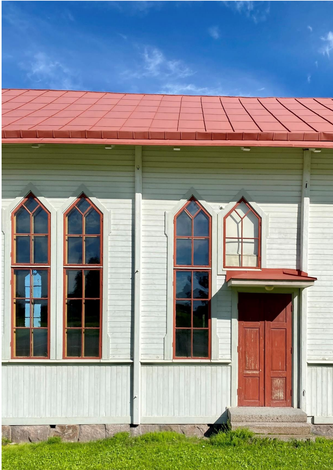
Figur 4. Stora salen har höga spetsbågiga fönster.