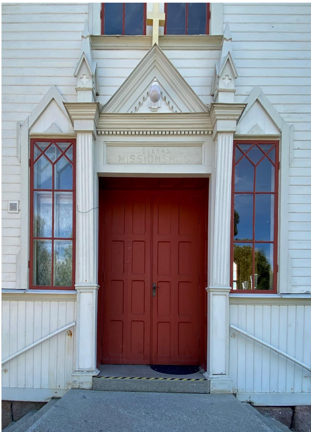
Figur 3. Den rikt utsmyckade huvudentrén, krönt av ett gyllene kors.