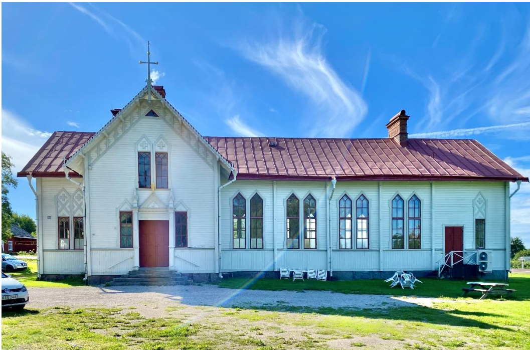
Figur 1. Missionshuset uppfördes 1877.

Söderås missionshus är beläget intill riksväg 80 i Söderås med en storslagen utsikt över Siljan. Mellan Söderås by och Siljan breder ett sluttande odlingslandskap ut sig.