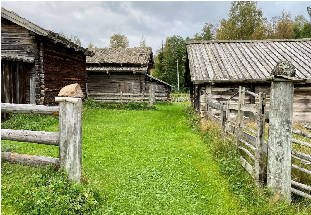
Figur 4- 2.Finngården.