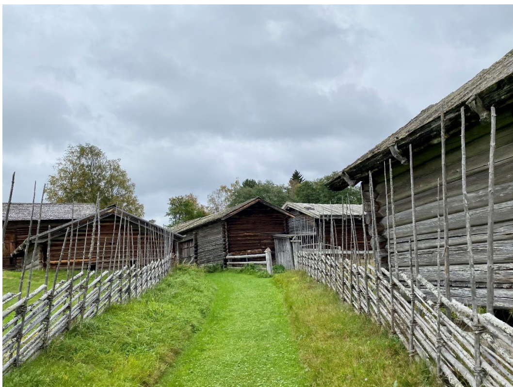
Figur 1. Bygatan mellan Nissnissgården (vänster) och Finngården (höger).

Gammelstans omgivning utgörs i dag av omväxlande åkrar, ängar och skogsmark. Av storskifteskartorna att döma gjorde det även det vid 1800-talets början.