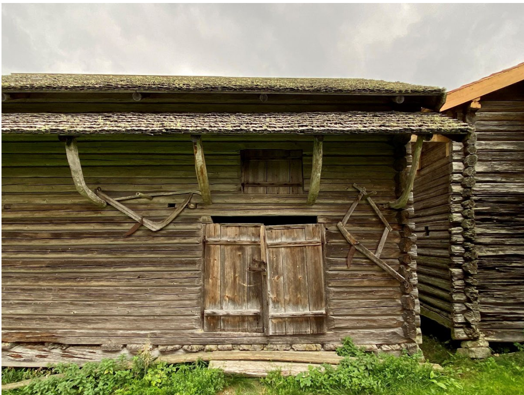
Figur 2-3. Nissnissgården.