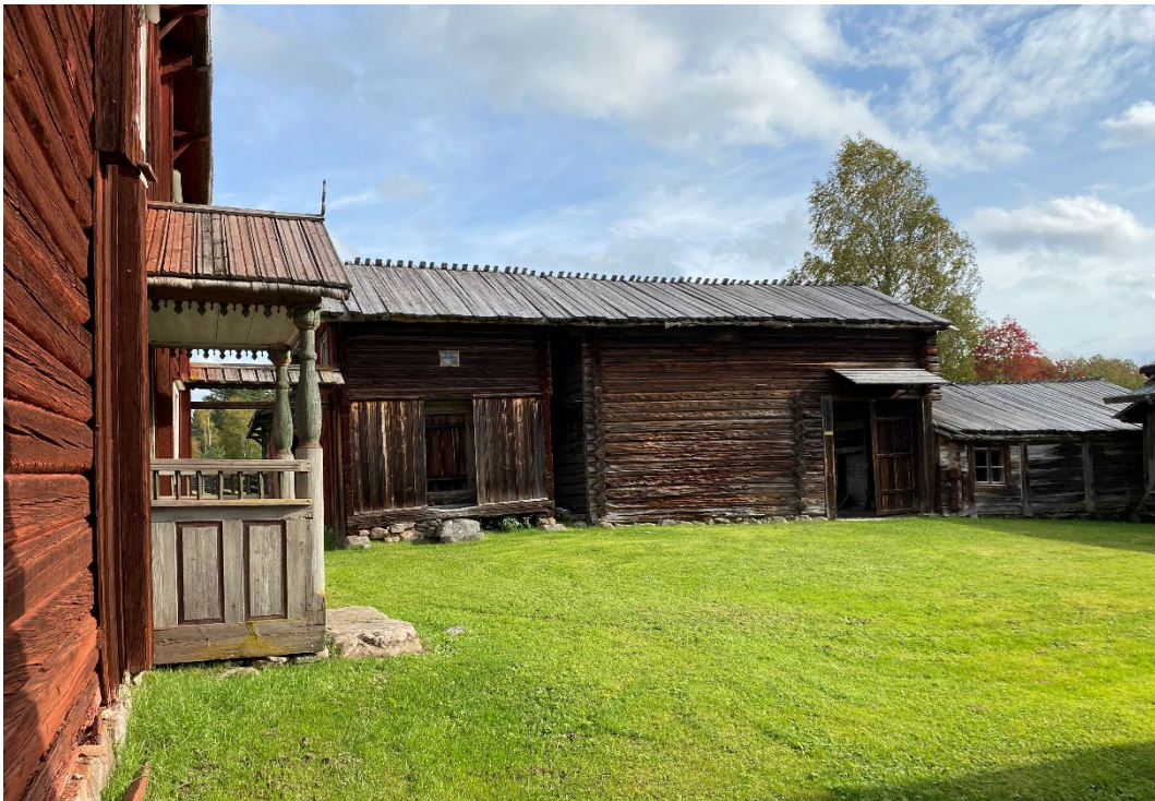
Figur 4. Den nordsvenska gårdens bebyggelse är samlad i en fyrkant runt gårdsplanen.