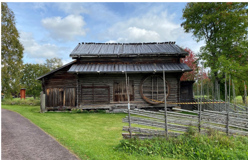
Figur 6. Kornladan.