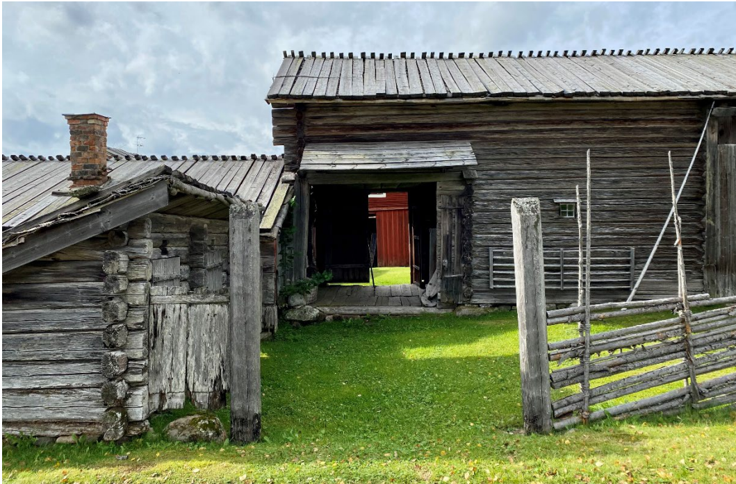
Figur 3. Majoriteten av bebyggelsen är omålad.