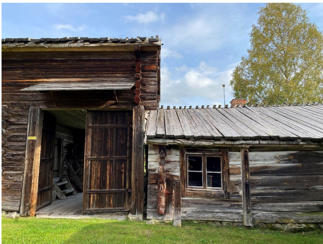
Figur 5. Gårdens ekonomibygnader är omålade.