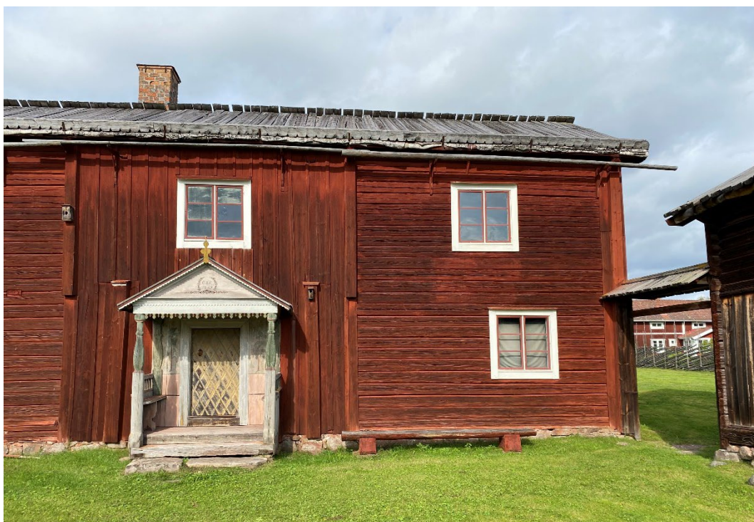
Figur 1. Mangårdsbyggnaden med anor från 1600-talet.