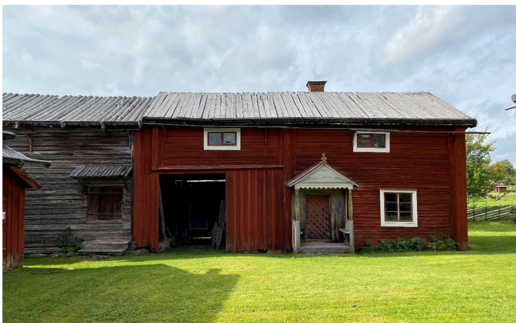
Figur 2. Bagarstugan.