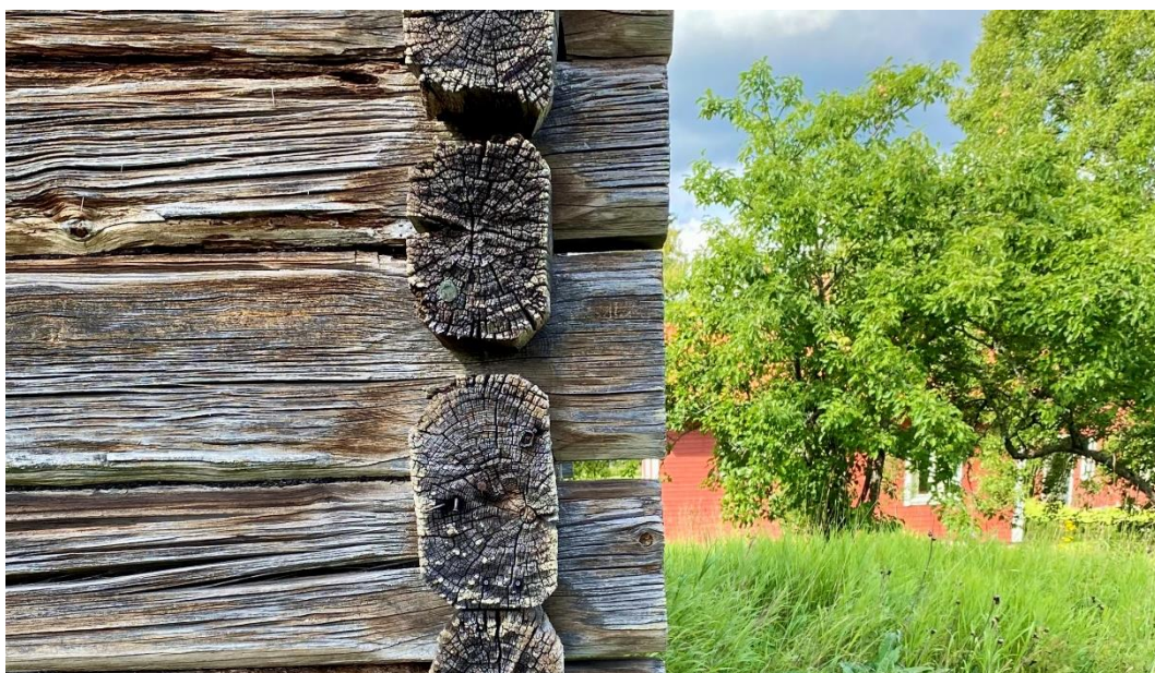
Figur 3. Bönhuset har en enkel, omålad fasad i liggtimmer.