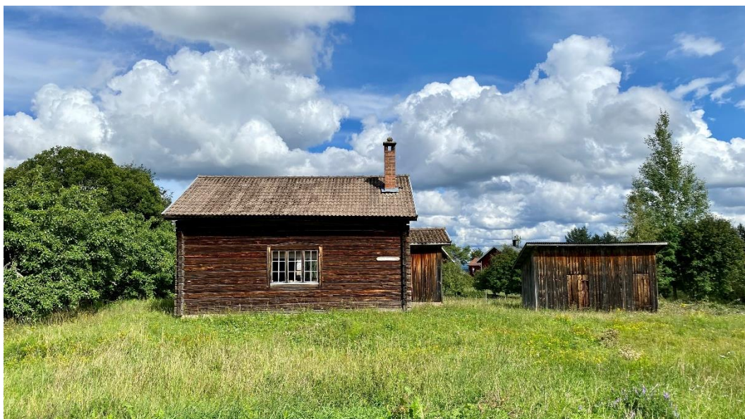
Figur 1. Bönhuset fick sin nuvarande placering 1942.

Byggnaden ligger i utkanten av Skattungbyn, långt från sockenkyrkan i Orsa och byns centrum. Baptiströrelsens uttalade opposition mot Svenska kyrkan kan vara en tänkbar förklaring till kapellets lokalisering i utkanten av byn och långt från sockenkyrkan.