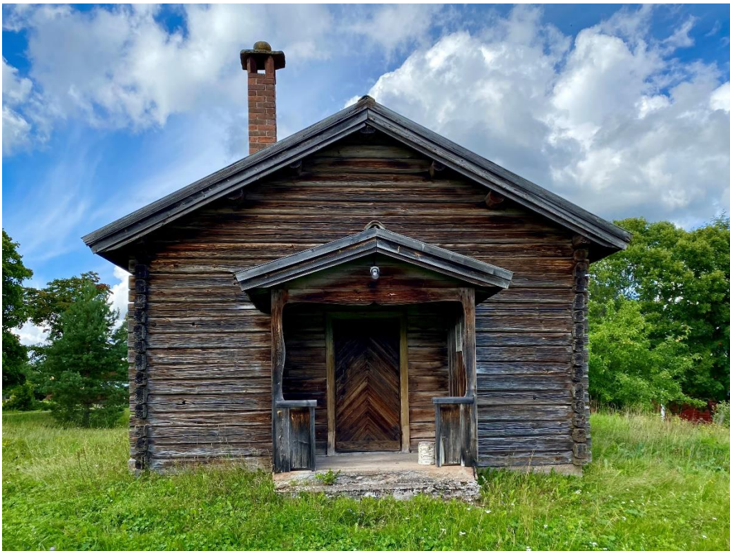
Figur 2. Entrén med vindfång leder rakt in i samlingsalen.

Nya fönster, ny dörr och skorsten sattes in i samband med flytten 1942. Dessutom anskaffades nya bänkar och elektriskt ljus drogs in. Uppvärmningen skedde tidigare med en järnkamin, antagligen av vindugnstyp, medan belysningen skedde med hjälp av två hängande fotogenlampor. Kapellets gamla bänkar, fönster och dörr förvaras sedan 1958 i baptistkapellet Tabernaklet i Kallmora. Trots de förändringar som skett kan kapellet anses vara väl bevarat i sin ursprunglighet.