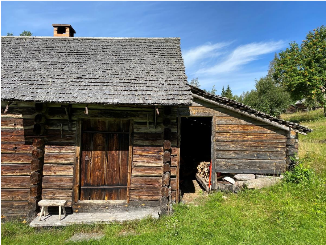
Figur 2. Bebyggelsen på fäboden har en välbevarad karaktär med omålade fasader och pärttak.

Byggnaderna, som i huvudsak är från början av 1800-talet, är genomgående knuttimrade och ofärgade. Samtliga har väl underhållna pärttak. Inga byggnader har byggts om under senare tid eller fått förändrad exteriör.