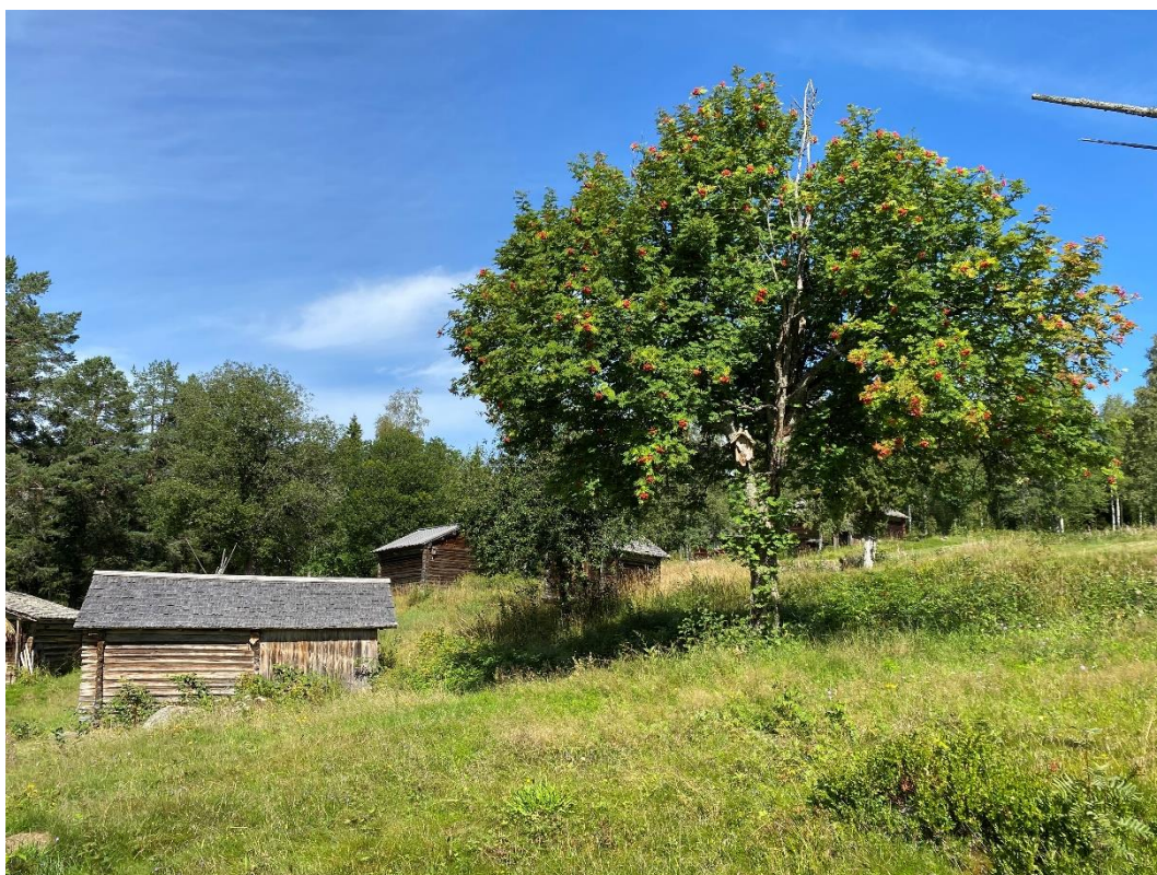
Figur 3. Fäboden består av totalt 17 byggnader.