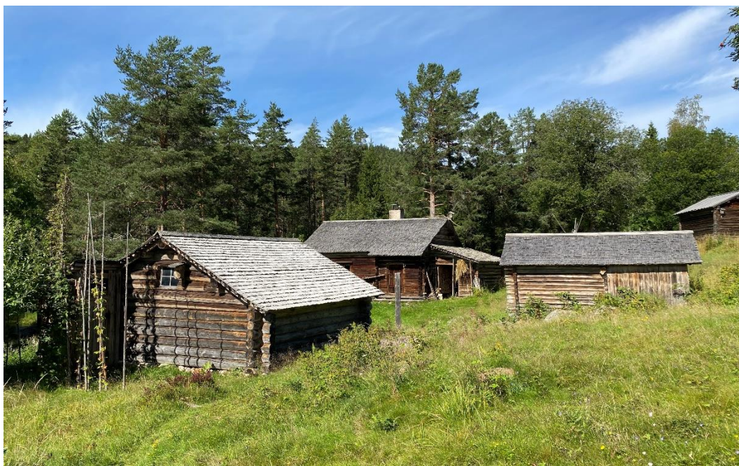
Figur 1. Södra Flenarnas fäbod nyttjades fram till 1980-talet.

Södra Flenarnas fäbod ligger vid Flenberget i Sollerö socken i Mora. Nordost om bebyggelsen på fäboden finns några smärre öppna tegar. I sydost finns stenrösen och hägnader som visar på tidigare öppen ängs- och åkermark.