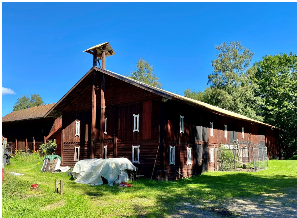
Figur 4. Ekonomilänga, troligtvis från år 1800.

Gården består av ett flertal byggnader, majoriteten av vilka har rödmålad timmer- eller träpanel och sadeltak belagt med lertegel. Ekonomilängan fanns sannolikt på gården redan år 1800, en byggnad som invändigt bland annat består av två timmerhus. Övriga byggnader är uppförda under perioden 1846-1940-tal.