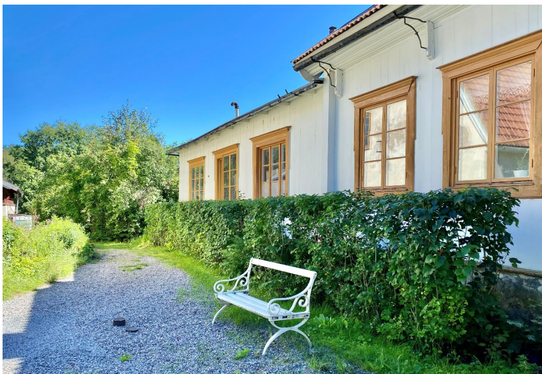
Figur 2. Köksflygeln på huvudbyggnaden, tillbyggd på 1800-talet.