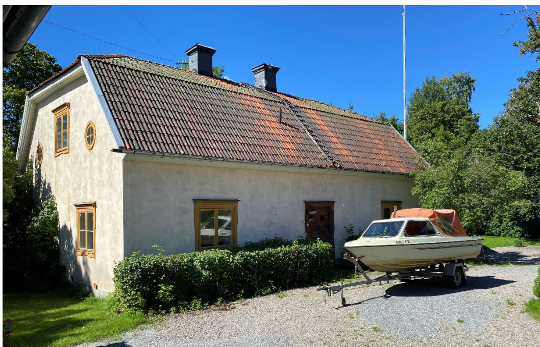
Figur 3. Västra flygeln, ursprungligen brukskontor. Östra flygeln på andra sidan gårdsplanen har samma utförande.