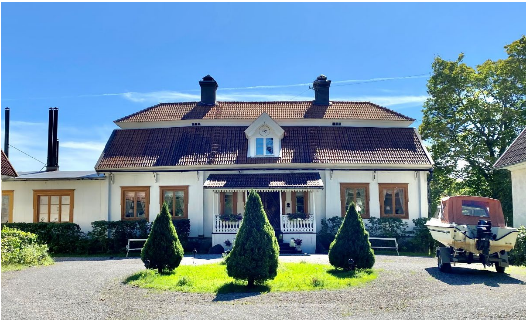
Figur 1. Corps-de-logiet, uppfört mellan 1760-1780.

När corps-de-logiet byggdes är oklart, troligen mellan ca 1760 och 1780. Byggnaden är uppförd i en och en halv våning av timmer. Den är idag klädd med vitmålad, slät panel med ockrafärgade foder kring fönstren. Byggnaden är av karolinsk typ med säteritak och sexdelad plan. På 1800-talet tillbyggdes mangårdsbyggnaden i ett par omgångar mot öster med en köksflygel i en våning. En veranda med snickarglädje tillkom också på gårdsfasaden mot norr. I det inre är den ursprungliga sexdelade planen intakt. Den mycket välbevarade fasta inredningen bär prägel av såväl 1700-talet som det sena 1800-talet.