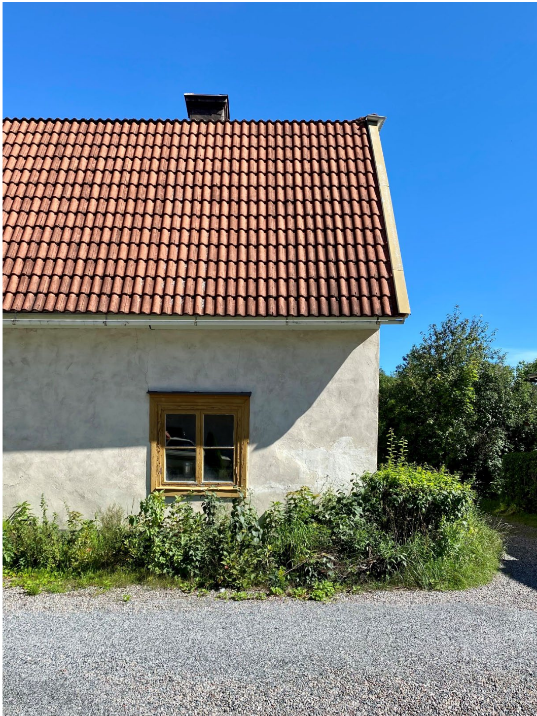
Figur 5. Båda flyglarna är troligtvis uppförda ca 1785 och murade i slaggflis och putsade.