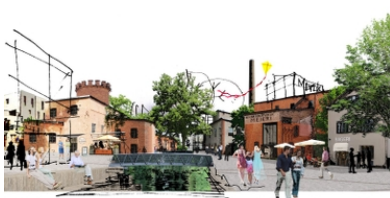
Planer på nytt mejeri i