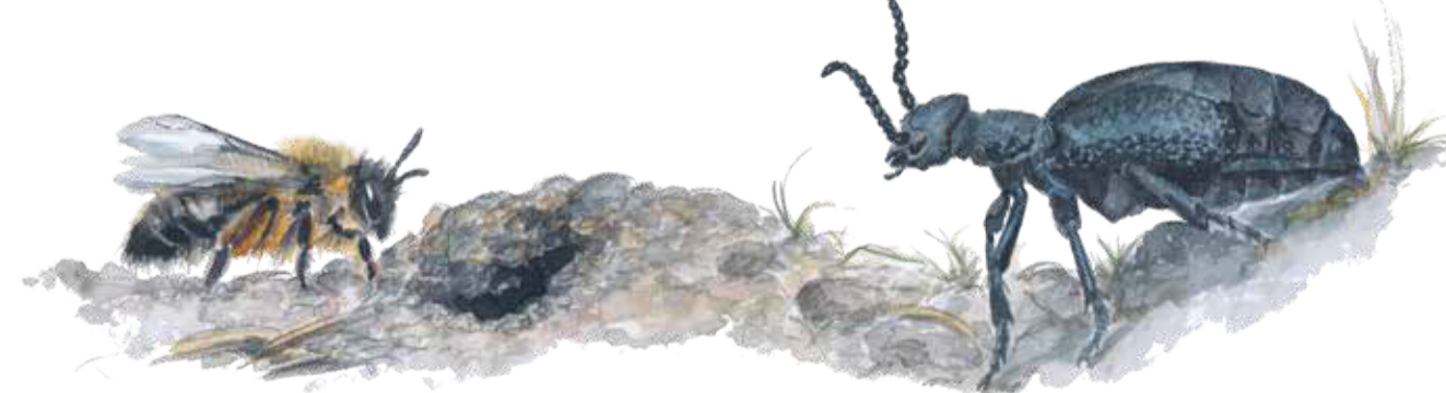
Gyllensandbi Andrena nigroaenea Buff mining bee

Under lång tid har vi människor satt vår prägel på Vens natur, främst genom jordbruket. Fiske har också varit en viktig sysselsättning. Både Bäckviken och Kyrkbacken är gamla fiskebyar med egna hamnar. Norrebrogs hamn byggdes först 1883 för att skeppa ut tegel från Vens 14 tegelbuk. Vid Möllebäckens utlopp låg Tycho Brahes pappersmølla. Idag ligger här en nygrävd damm och du kan se de gamla dammvallarna vid bäcken. Det finns mycket spännande att upptäcka på denna lilla ö. Välkomna ut.