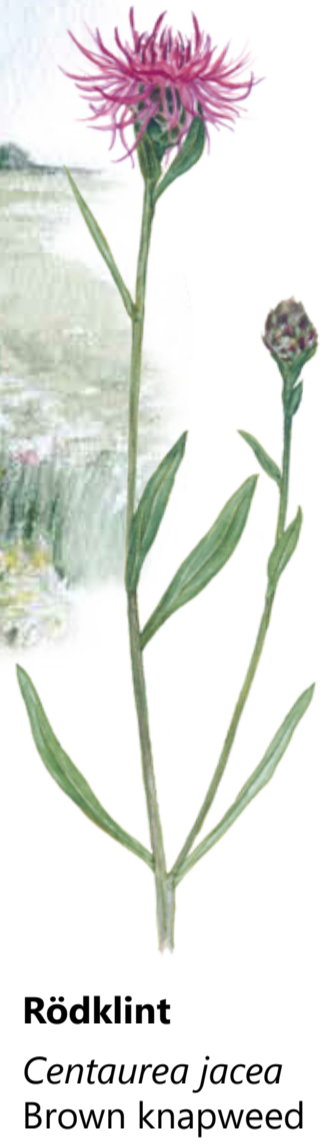
Rödklint Centaurea jacea Brown knapweed