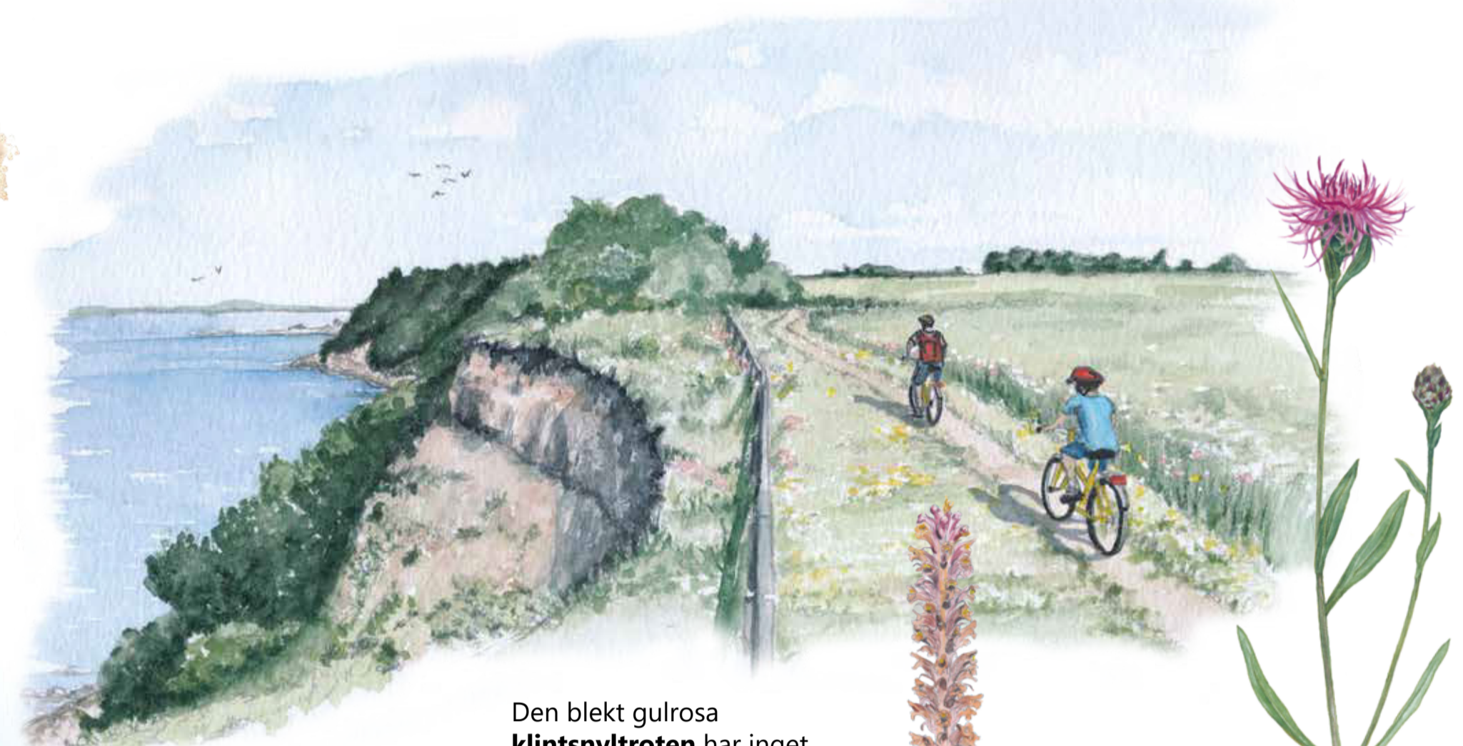
Den blekt gulrosa klintsnyltroten har inget klorofyll utan måste snylta på andra växter för att överleva. Den parasiterar oftast på väddklint eller rödklint. Orobanche elatior Knapweed broomrape