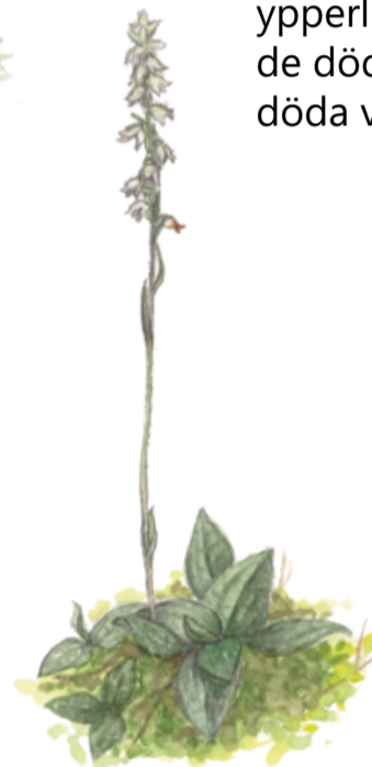
Linnéa Linnaea borealis Twinflower

Både sparvugglan och den mindre hackspetten är de minsta av sitt slag i Europa – inte mycket större än sparvar. Båda arterna trivs ypperligt i Nytebodaskogen, där det finns gott om bohål i de döda och gamla träden. De vedlevande insekterna i den döda veden är perfekt mat åt skogens hackspettar.