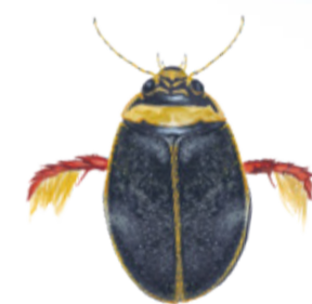
Bred paljettdykare Graphoderus bilineatus A water beetle

Kroksjöarnas rena vatten hyser ett rikt insektsliv. Här lever den ovanliga skalbaggen bred paljettdykare och larven till citronfläckad kärrtrollslända.