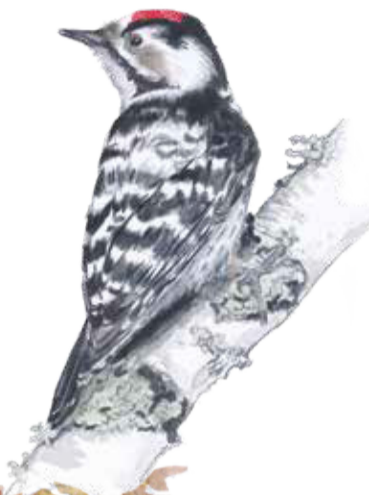
Mindre hackspett Dryobates minor Lesser spotted woodpecker