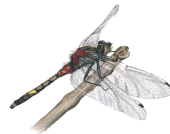
Citronfläckad kärrtrollslända Leucorrhinia pectoralis Yellow spotted whiteface dragonfly