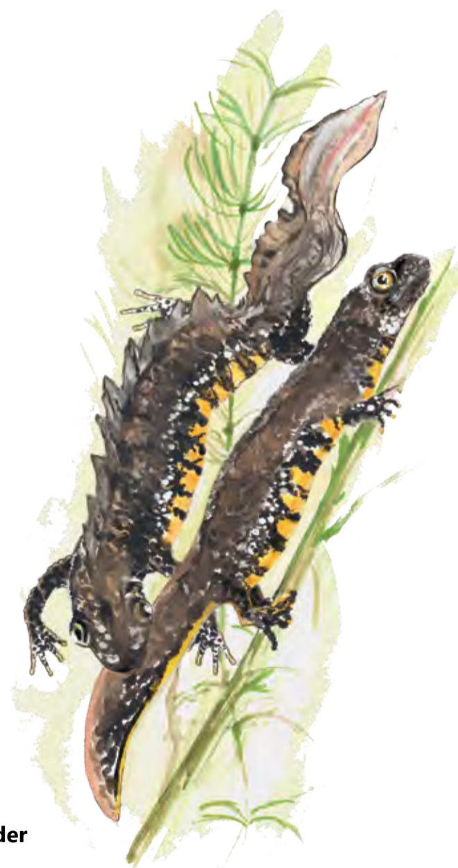
Större vattensalamander Triturus cristatus Great crested newt

Vid åsens fot ligger fuktiga lövsumpskogar med mörka vattenspeglar. Där det är torrare växer gamla ekjättar och högresta bokar. Det är gott om död ved och gamla träd i skogen. Här trivs hackspettar som spillkråkan och gröngölingen. Det är också hemvist för sällsynta lavar och svampar, som stiftklotterlav, bokvårtlav och oxtungssvamp.