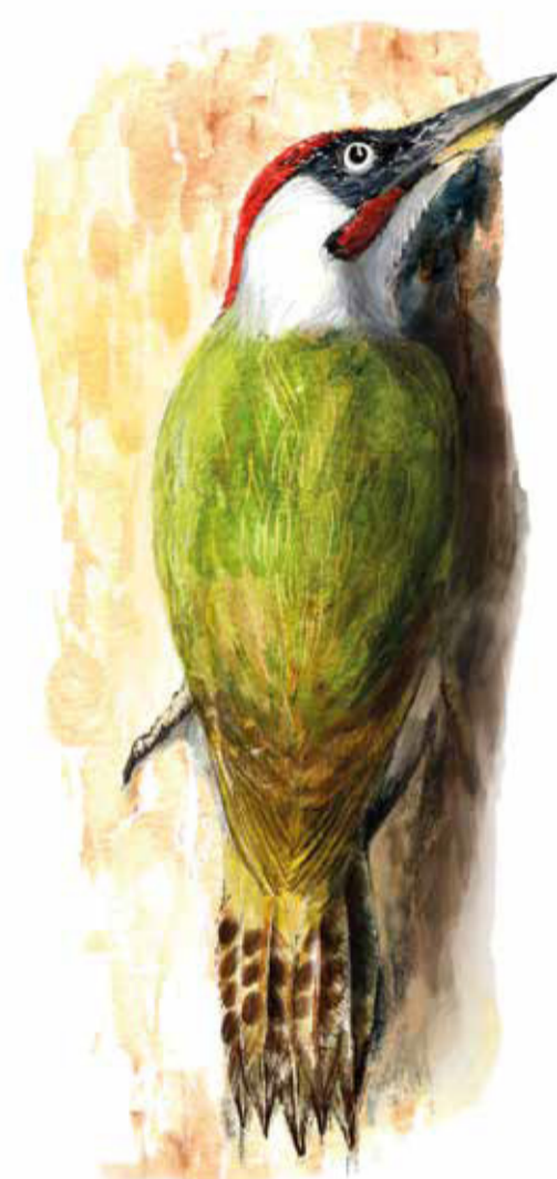
Gröngöling Picus viridis Green woodpecker

Som en orm slingrar sig rullstensåsen genom landskapet. På Järens rygg kan du vandra från Hörröd till Agusa genom grönskande bokskogar. Njut av lundens blommor och ta en paus i Prästabarnens kaffegrotta.