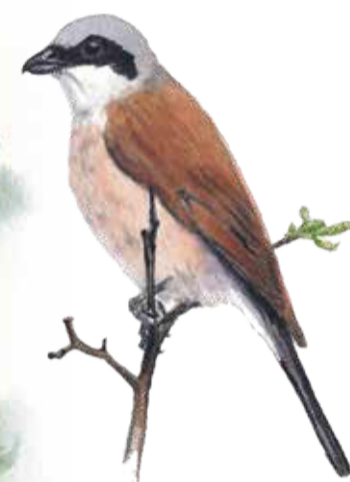
Törnskatan kan du se i toppen av en buske, där den spanar efter insekter att äta. Lanius collurio Red-backed shrike

På denna steniga höjd med enar och ljung har Hörrödsböndernas djur gått på bete genom århundradena. Betesdjur och natur har tillsammans skapat dessa gräsmarker med örter, insekter och fåglar. Trots utelivet bete under ett par årtionden kan du få se några av fåladsmarkens typiska arter, som backtimjan och ängsvädd, gröngöling och törnskata. Du tar dig lätt genom reservatet på Skåneleden. Och varför inte ta en fika vid rastplatsen i norr.