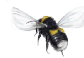
Blålockshumlan är en av våra vanligaste humlor. Den syns ofta på blålockor och hagtorn. Bombus soroensis Broken-belted bumblebee