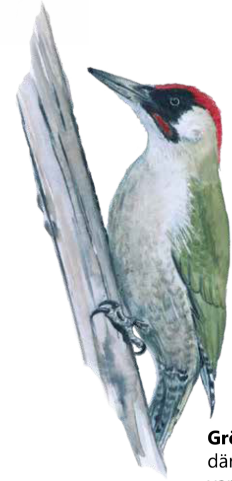
Gröngölingen trivs där betesmarker varvas med lövskog. Den gröna ryggen ger bra kamouflage när den letar mat på marken. Myror står överst på menyn. Picus viridis Green woodpecker

Där det är gott om insekter trivs också fåglarna. Gulspår och gröngöling letar ofta mat på marken, medan törnskatan spanar från buskens topp. De taggiga och täta en- och hagtorsbuskarna ger bra skydd mot rovdjur och lä för väder och vind.