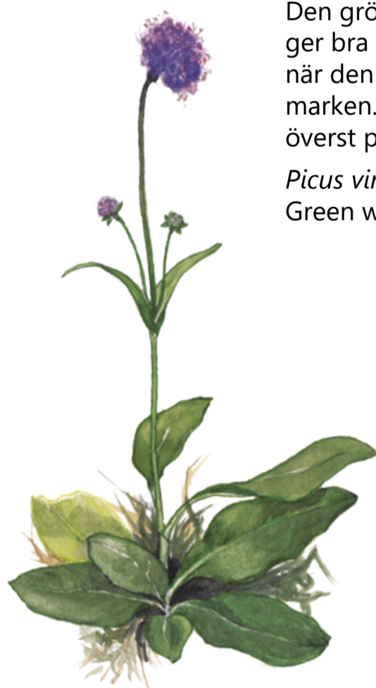
Ängsvädd växer där det är lite blötare, som i fuktängen i reservatets nordvästra del. Succisa pratensis Devil's bit scabious