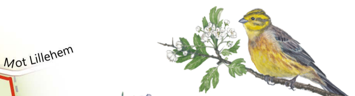
Gulspår är lätt att känna igen med sitt gula bröst. Emberiza citrinella Yellowhammer