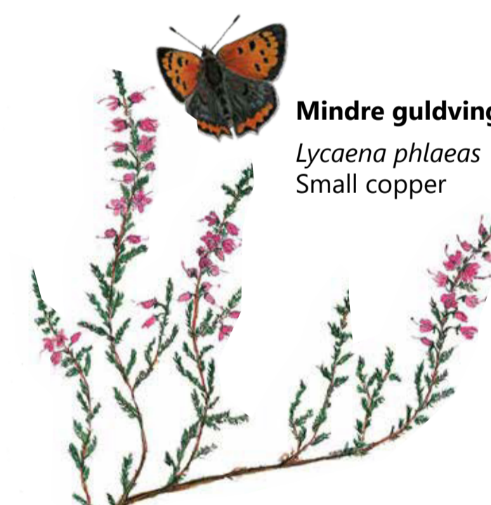
Ljung Calluna vulgaris Heather

On this rocky hill with junipers and heather, the animals belonging to the farmers of Hörröd have been grazing for hundreds of years. Grazing animals along with nature, have together created these grasslands with flowers, insects, and birds. Despite the lack of grazing over the last few decades, you can still see some of the typical pasture species, such as breckland thyme and devil's bit scabious, green woodpecker and red-backed shrike.