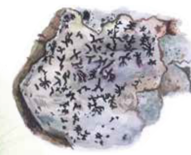
Opegrapha vermicellifera Lichen

Stiftklotterlaven visar att skogen har höga naturvärden. Där stiftklotterlaven växer finns det ofta fler ovanliga arter.