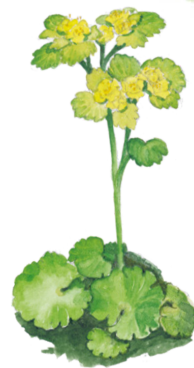
Gullpudra Chrysosplenium alternifolium Alternate leaved golden saxifrage

I alkärren lyser gullpudran upp den mörka myllan med sina klargröna blad.