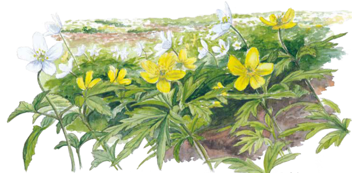
Vitsippa Anemone nemorosa Wood anemone