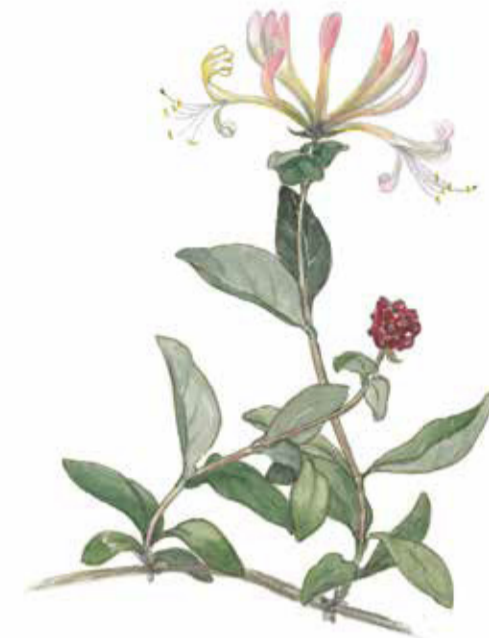
Viildkaprifol ( Lonicera periclymenum ) Wild honeysuckle

The shallow shore is used by migrating wading birds for resting and feeding. The Nature Reserve extends out to the three metre contour line. The marine area beyond is included in Grollegrund marine Nature Reserve which includes approximately 1580 ha. The shallow, hard sea bed is an important breeding and foraging ground for fish.