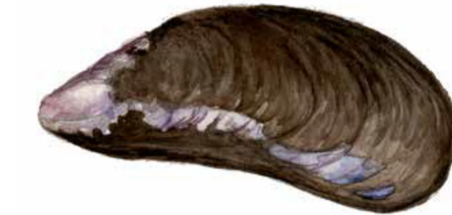
Blåmussla ( Mytilus edulis ). Deras tomma skal är vanliga fynd på stranden. Blue mussel