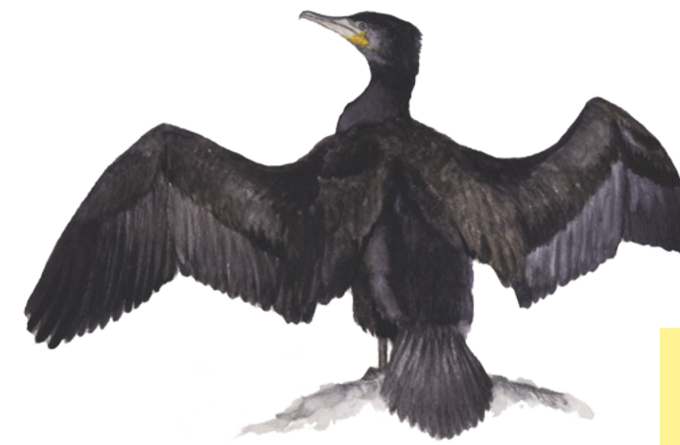
Storskarv ( Phalacrocorax carbo ) syns ofta sittande på stenar ute i havet, antagligen för att torka vingarna. Cormorant