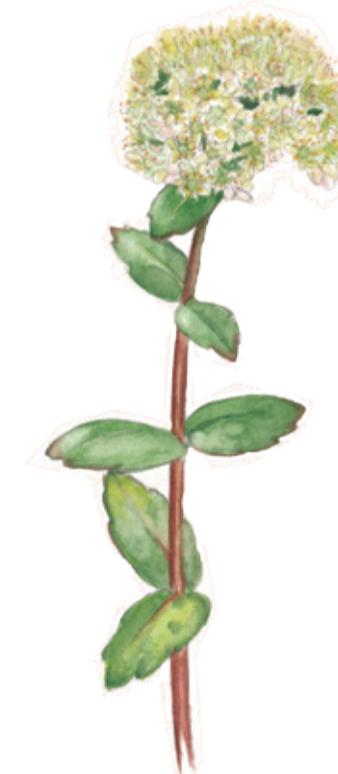
Kärleksört ( Sedum telephium ) sågs som ett bevis på att kärleken blomstrade. Orpine