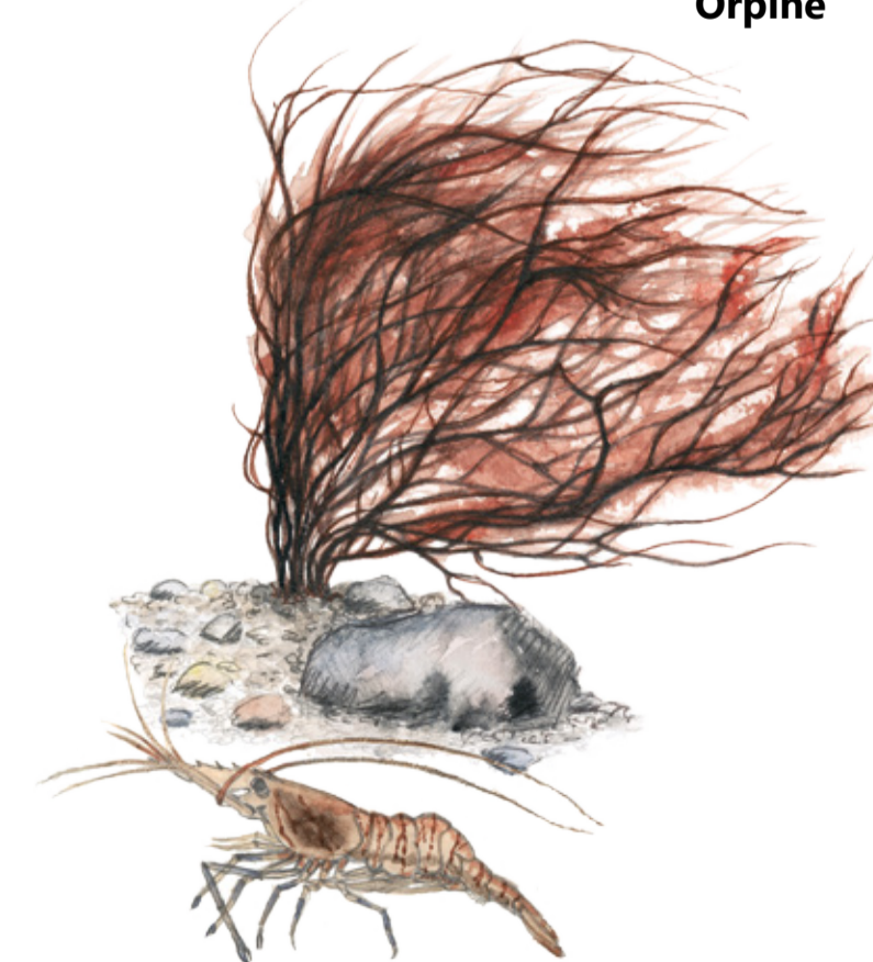
Havsris ( Ahnfeltia picata ) och sandräka ( Crangon crangon ) är vanliga arter i den marina delen av reservatet. A red seaweed and brown shrimp