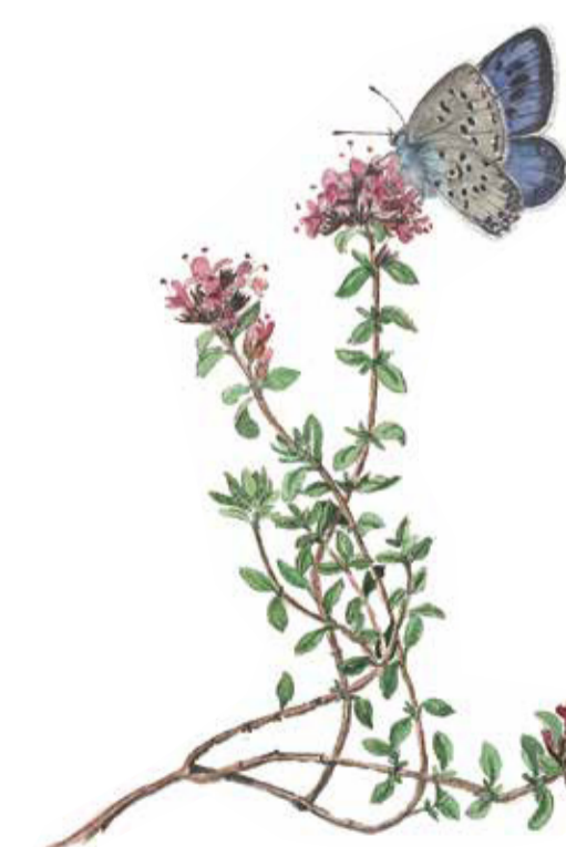
Backtimjan ( Thymus serpyllum ) sprider en svag doft när man promenerar över de sandiga markerna. Breckland thyme