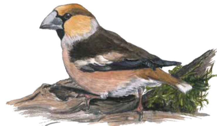
Stenknäcken trivs i lövskog där det finns gott om frön och kärnor att äta. Den kan knäcka körsbärskärnor med sin kraftiga näbb! Coccothraustes coccothraustes Hawfinch