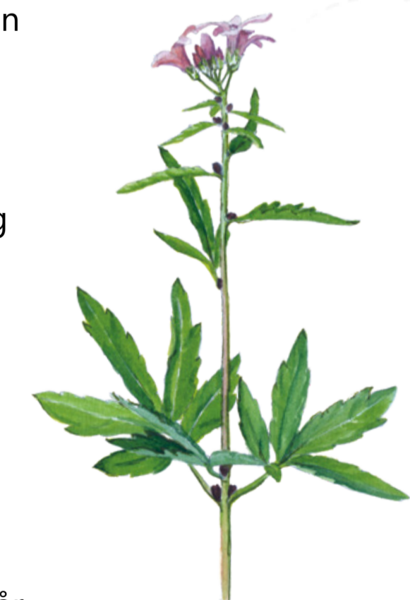
Både tandrot och myssmadra trivs i den näringsrika myllan kring Ulfsbjär. I juni kan du se små svarta knoppar i tandrotens bladveck. Det är så kallade groddknoppar som faller av och gror till nya plantor. Cardamine bulbifera Coral root