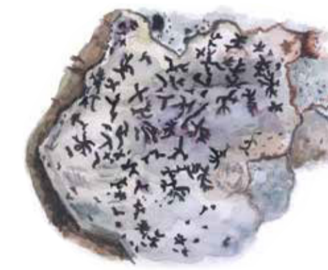
Opegrapha vermicellifera A lichen

The Reserve stretches from the rocky shores of Lake Dagstorpssjön in the north to the slopes of the old volcano Ulfsbjär in the south. Well-trodden paths take you through the area with ease. You can spend the night and have a barbecue at the shelter by the lake or have a snack at one of the picnic areas in the shade of the beech trees. Welcome out!