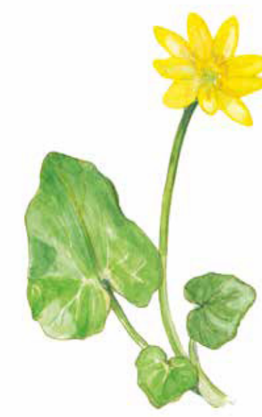
Svalört Ranunculus ficaria Lesser celandine