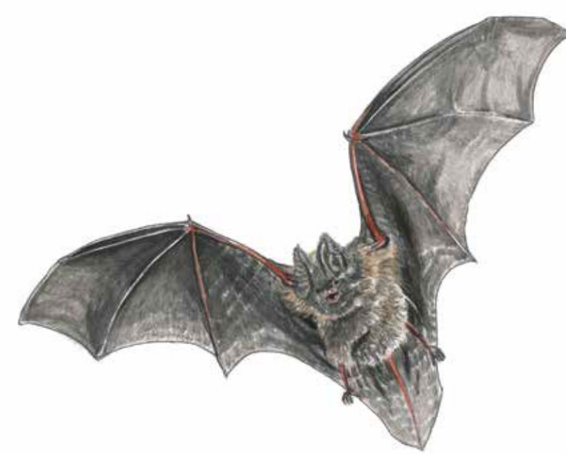
Barbastella barbastellus Barbastelle bat

If you follow the Skåneleden Trail through the reserve, you pass a huge, black stone called the Karrastenen Stone. It reminds us of times gone by, when there was a dance floor here in the shade of the tree canopies. Anyone that managed to lift the stone was considered to be a real man; a right of passage for the local men.