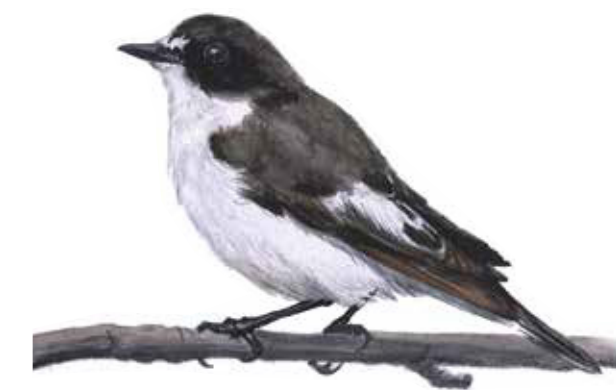
Ficedula hypoleuca Pied flycatcher

De håliga gamla träden blir perfekt bostad åt den svartvita flugsnapparen andra hålbyggande fåglar.