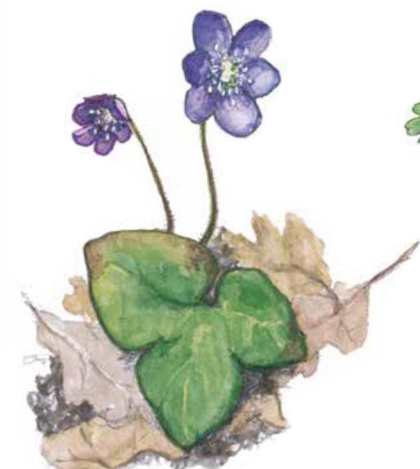
Blåsippa Anemone hepatica Liverleaf