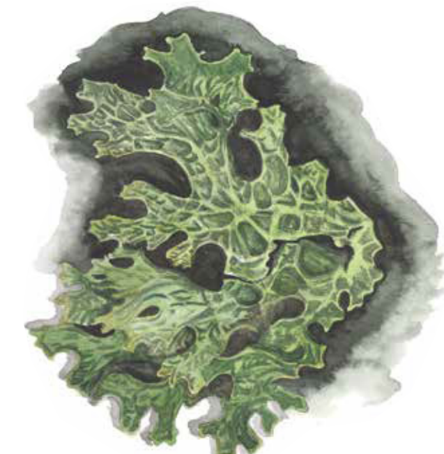
Lunglaven trivs i fuktig miljö, på gamla lövträd. Lobaria pulmonaria Lungwort

Storrams tillhör samma familj som liljekonvalj. De klokliska blommorna är doftlösa och de blåsvarta bären är giftiga.