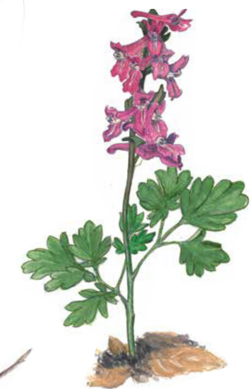
Hålnunneört Corydalis cava Bird-in-a-bush