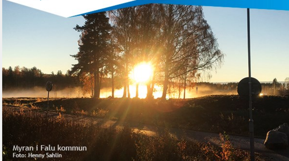
Myran i Falu kommun