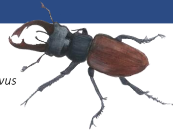
Ekoxe Lucanus cervus

Närmast vattnet breder strandängar ut sig. Där sköljer vågorna in ibland vilket gör att salttåliga växter som strandkrypa och saltåg trivs. Intill klippor och längs bryn växer hagtorn, björnbär, kaprifol och vildrosor, bland annat den sällsynta flikrosen. Betade strandmiljöer är även viktiga fågellokal.