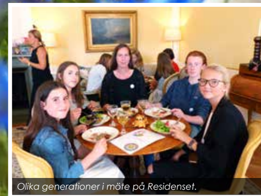
Olika generationer i möte på Residenset.