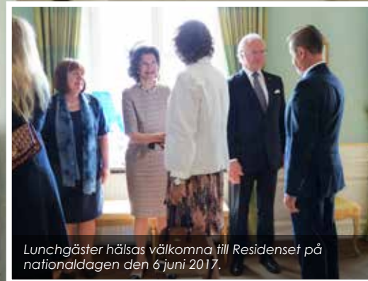
Lunchgäster hälsas välkomna till Residenset på nationaldagen den 6 juni 2017.

Residenset har årligen flera tusen besökare som under organiserade former diskuterar allt från turism, globalisering och naturreservat till kvinnligt företagande och det goda arbetslivet. När vi bjuder in till möten på Residenset är vi måna om en god representation från många delar av samhället.