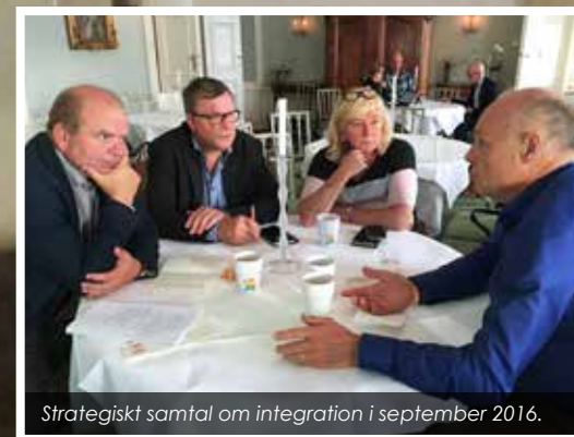
Strategiskt samtal om integration i september 2016.