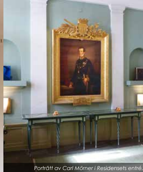
Porträtt av Carl Mörner i Residensets entré.