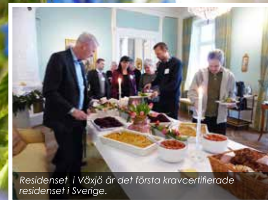
Residenset i Växjö är det första kravcertifierade residenset i Sverige.