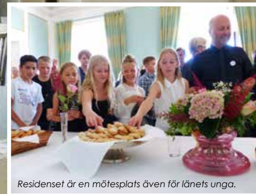
Residenset är en mötesplats även för länets unga.