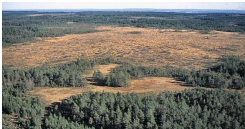
Sydbillingens platå är ett av södra Sveriges största sammanhängande vildmarksområden.

Skogsmarkerna finns i huvudsak inom de västra delarna av reservaten samt runt mossarna i öster. Skogarna är i hög grad orörda och har en ursprunglig karaktär, till största delen genom en naturlig förnyring efter 1800-talets intensiva betning och skogsbruk.