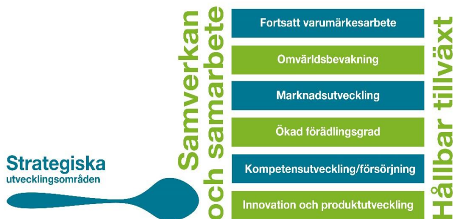
Figur 2. Två övergripande perspektiv och sex utvecklingsområden

Två övergripande perspektiv spänner över alla utvecklingsområden och ger därför det grundläggande förutsättningarna för allt arbete: samarbete och samverkan , samt hållbar tillväxt (se figur 2). Den hållbara utvecklingen är baserad på de tre dimensionerna social, ekologisk och ekonomisk hållbarhet. Med större medvetenhet, ökad kunskap och systematik möjliggörs en gradvis och kontinuerlig förflyttning mot ökad hållbarhet.