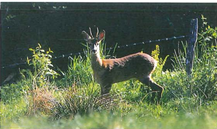
Rådjuren trivs i kulturlandskapet.