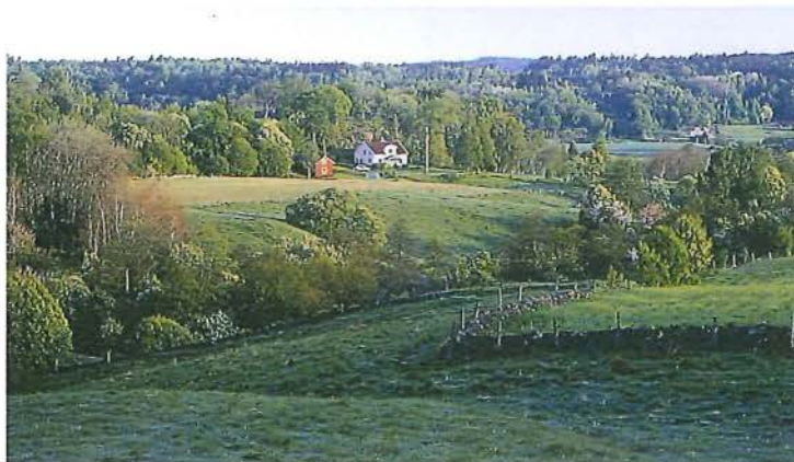
Under försommaren blommar hägg och apalar.