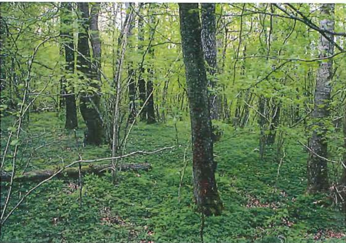
Om våren är fågelsången bedövande i den lummiga lövskogen.