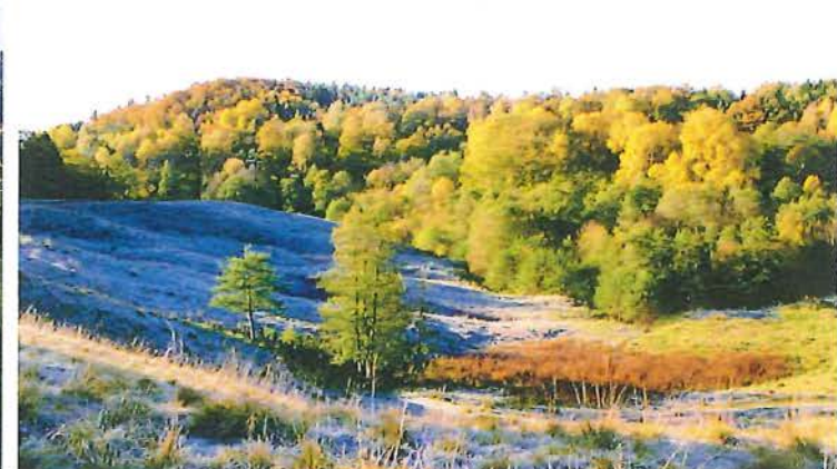
På hösten lyser asparna gyllengult.

Naturreservatet som är 46 ha stort, ligger strax öster om Alafors i Starrkärrs socken, Ale kommun. Det består av äldre lövskog, ängar och skogbeksäddade bergbranter. Största delen av området har beskogsats på naturlig väg. Genom hela reservatet rinner en bäck i en djup dalgång.