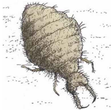
Myrlejonsländans larv. Teckning Tomas Ljung.