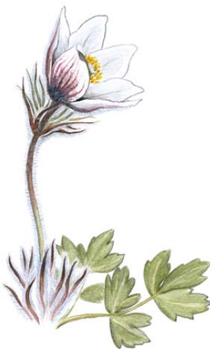
Mosippan trivs i sanden på Flygsandfältet. Teckning Jonas Lundin.

Larven kallas för myrlejon. Den är ett rovdjur som gräver gropar i sanden. Den ligger sen gömd på botten av gropen och lurar på myror eller andra insekter som trillar ned i den lösa sanden. Genom att sprätta sand på bytet hindrar myrlejonet detta att komma upp ur gropen. Den suger ur sitt byte med kraftiga käkar. Larverna kan förflytta sig flera meter i sanden genom att gräva sig baklänges, varvid de efterlämnar karaktäristiskt snirklande ”plogfårar” i ytskiktet av lös sand.