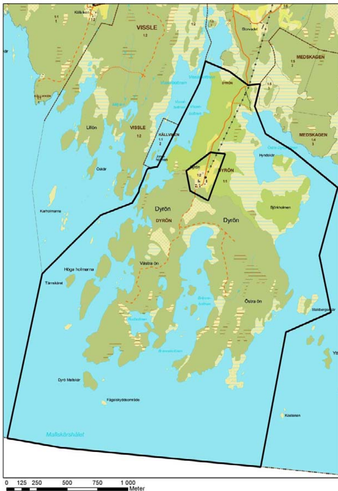
Beslutscharta för naturreservatet Dyrön (heldragen svart linje)

Miljöavdelningen Naturvårdsenheten Per Gustafsson