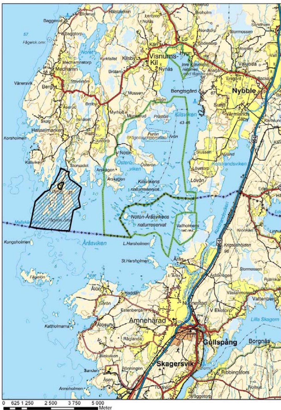
Översiktskarta för naturreservatet Dyrön (skrafferat område)

Miljöavdelningen Naturvårdsenheten Per Gustafsson