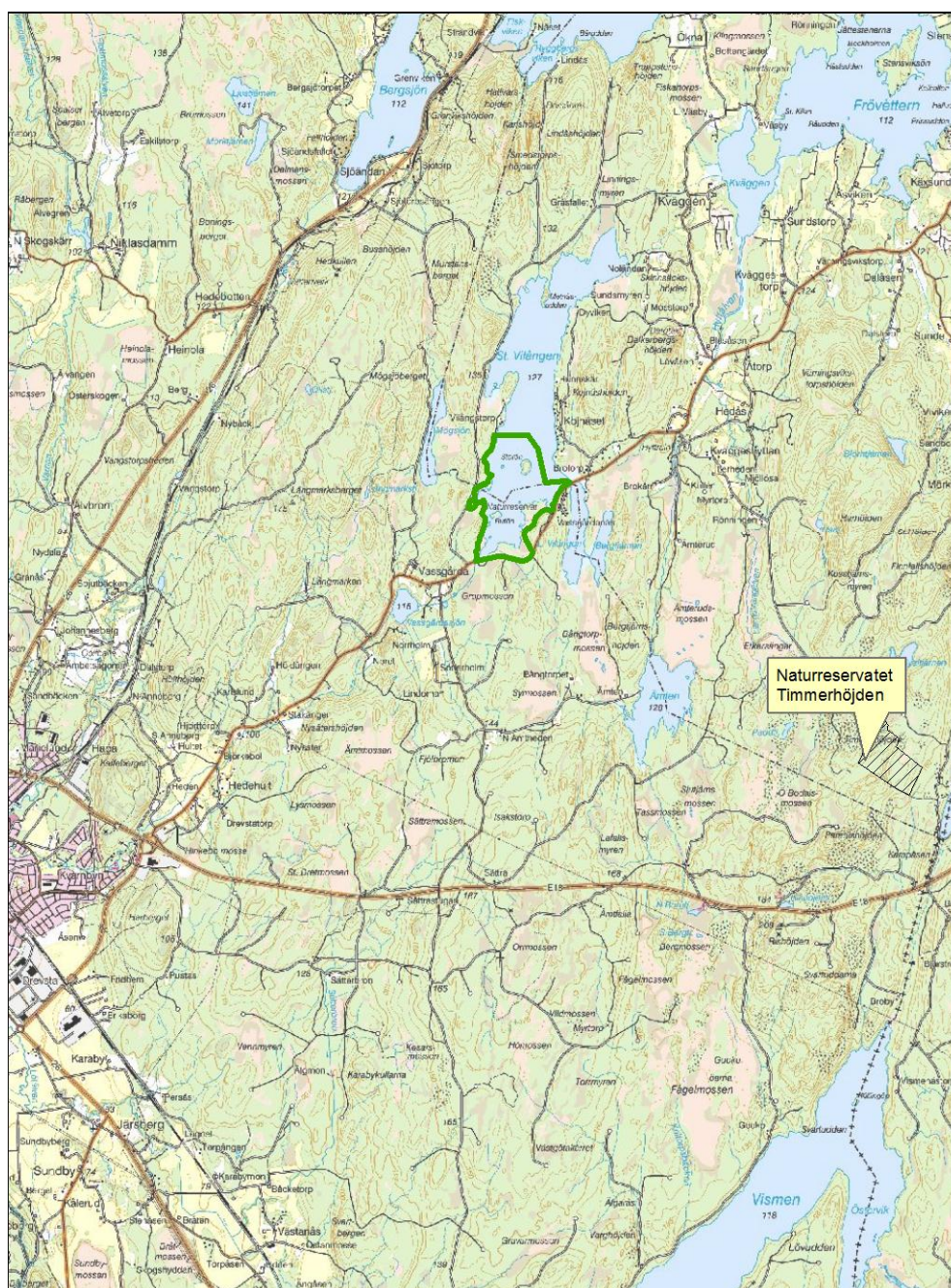
Översiktskarta för naturreservatet Timmerhöjden