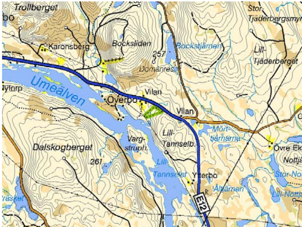
Figur 1. Översiktskarta för naturreservatet Överbo.

Tillgången på tallågor är överlag sparsam och de flesta lågorna hittas i områdets nordöstra del. Inom reservatet finns även ett mindre bäckdråg som rinner ifrån nordväst till sydöst. Granskogen vid detta dråg är högre och i det produktiva fältskiktet hittas ett flertal arter av ormbunkar och högre örter. Exempel på arter som hittas kring detta dråg är älggräs, väderot, ekbräken, hultbräken, majbräken, brännässla, brunrör, grön- och svartviden. Kring detta fuktigare dråg hittas ej några spår av skogsbrand och enstaka stående döda granar och lågor finns i direkt anslutning till ravinen. Längs dråget kan man hitta enstaka lågor med rödlistade vedsvampar som gränsticka och rosenticka, men även spår efter den missgynnade och vedlevande skalbaggen bronshjon finns i området. På några få platser i de brandpräglade och talldominerade delarna finns även äldre spår av den rödlistade reliktbocken, samt mindre mägborre. Dessa två skalbaggsarter är knutna till öppna och varma tallnatureskogar.