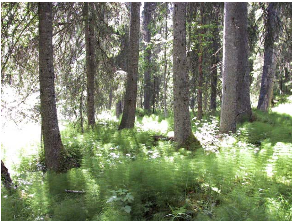
Bild. Genom reservatet rinner en mindre bäck och skogen ändrar här sin karaktär, från att vara karg och talldominerad till en mycket produktiv ört- och fräkenrik granskog.