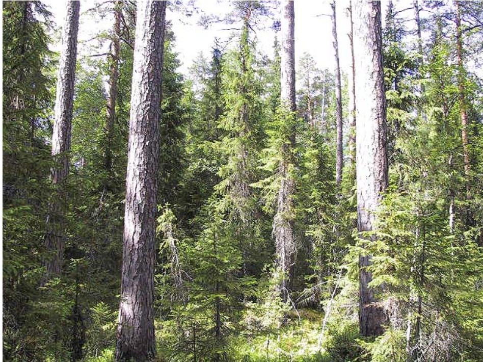
Bild. Inom de brandpräglade delarna av reservatet har granen starkt börjat att återkolonisera tallskogen. Om inte dessa tallskogar restaureras, dvs bränns eller röjs, kommer reservatet att förlora en del av de naturvärden som finns.