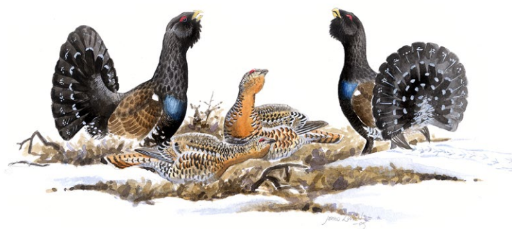
Tjäderspel. Illustration: Jonas Lundin

Förr i tiden var det liv och rörelse i skogen. Det finns rester efter minst fem kolbottnar med tillhörande kolarkojor i reservatet. Från norr till söder löper en mycket gammal vandringsväg genom skogen. Med åren har den