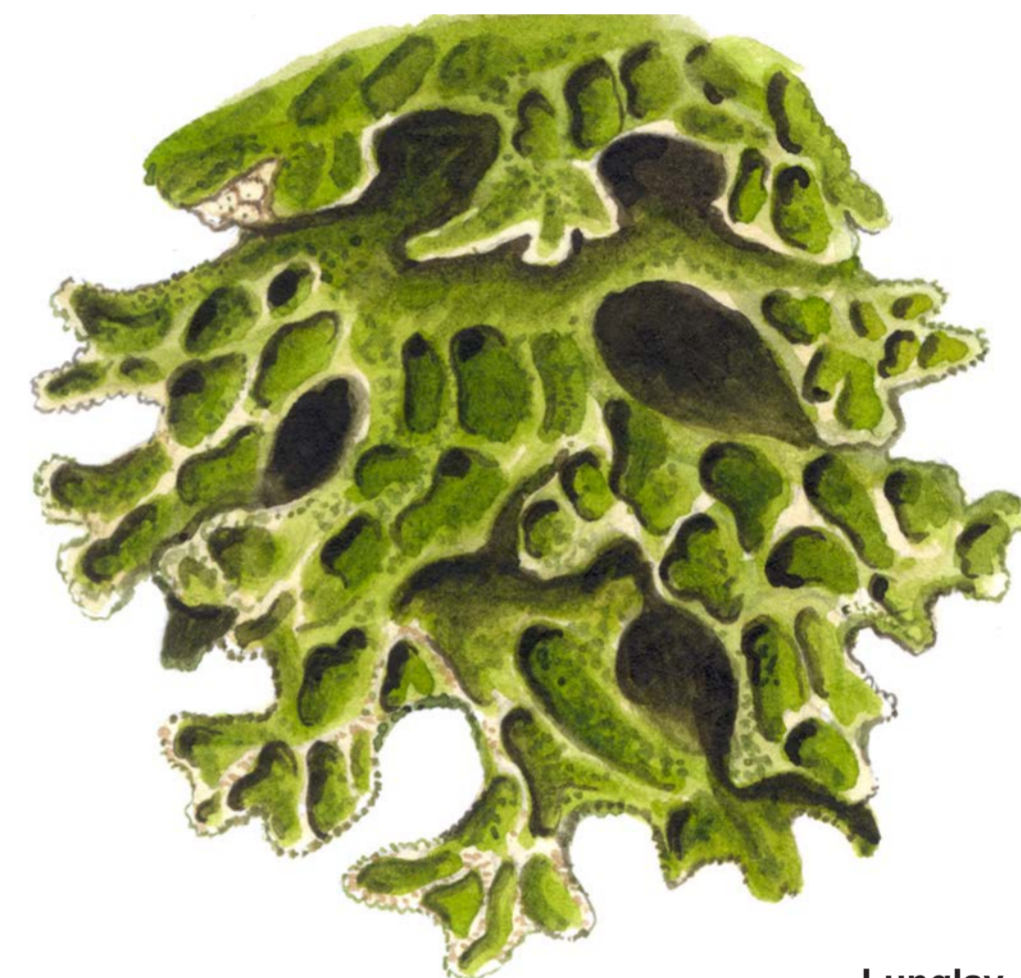
Lunglav Lobaria pulmonaria