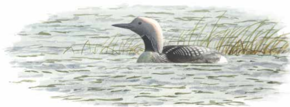
Storlom Gavia arctica

En del av Malingsbo-Kloten. Malingsbo-Kloten är ett 970 hektar stort, barrskogsdominerat och sjörikt naturreservat i ett landskap präglat av århundraden av skogsbruk, odling, bergsbruk och järnhantering. Det stora reservatet är mycket välbesökt tack vare området goda förutsättningar för vandring, paddling och fiske. Lustigkulle-Rågåstjärn ligger i Malingsbo-Kloten, men i Lustigkulle-Rågåstjärn gäller andra regler för markägare och besökare än i det omgivande reservatet.