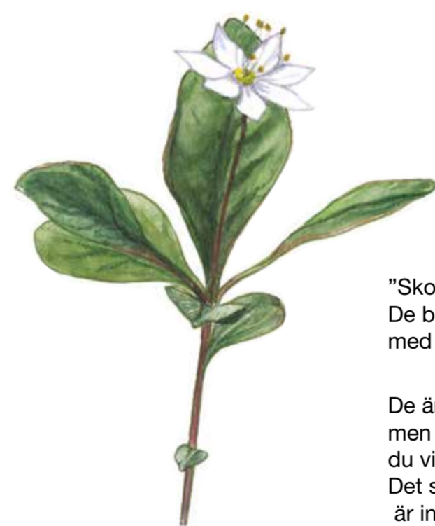
Skogstjärna Trientalis europaea

"Skogstjärnorna frodas aldrig. De bara reder sig med karg näthet i mossan.